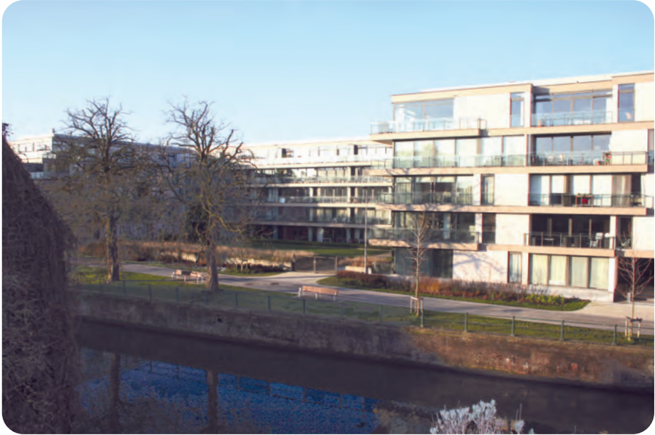
Afb. 9. Gezicht vanaf de Visserij op het appartementencomplex dat in de plaats kwam van de brouwerij Meiresonne. Dit geheel van ongeveer honderd appartementen en studio's is nu langs de Schelde omgeven door een woonerf, aangelegd in 2018. Het autoverkeer werd er gebannen (foto Bo De Baets, 2020).