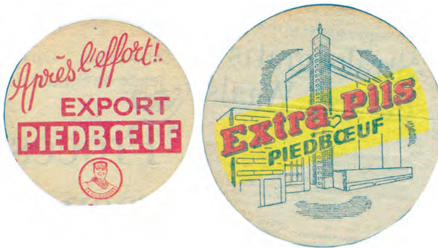
Afb. 2. Twee bierviltjes van de succesvolle pils en de 'export' Piedboeuf.