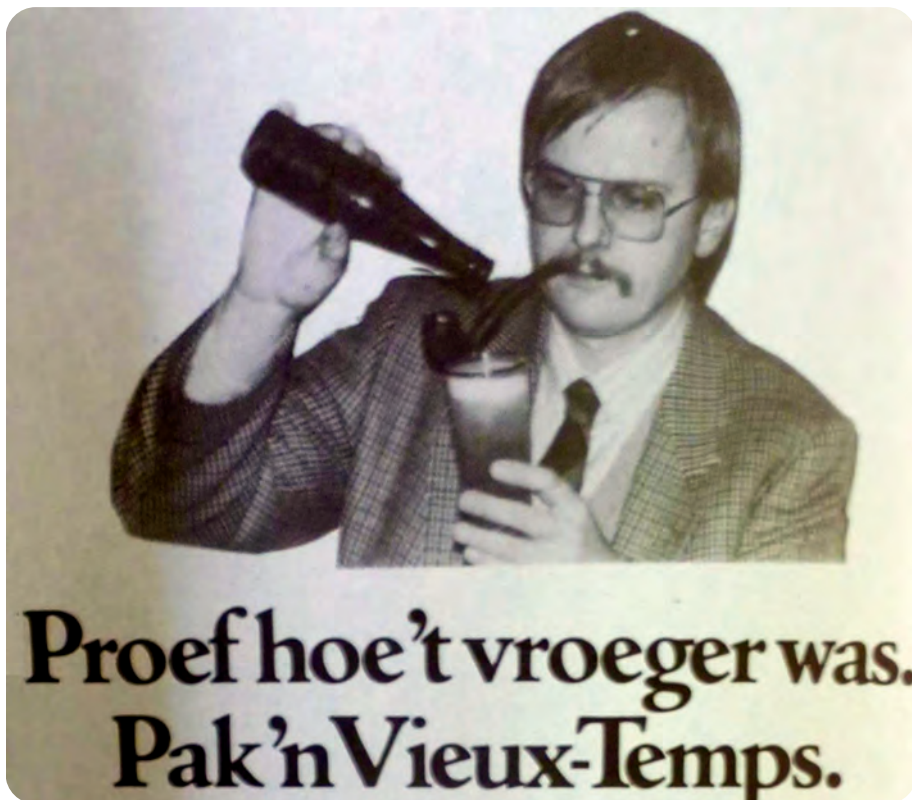
Afb. 3. De originele Piedboeuf van de brouwerij in Jupille werd nog tot in de jaren 1990 gepromoot in bepaalde Gentse cafés. Hier een opname uit 1987 in café Den Teugel, Papegaaistraat.

1973 tot 19 procent. Dat van Jupiler, opvolger van de Piedboeuf pils, was gestegen van 6 naar 31 procent. Gelukkig voor Artois had Stella steeds meer succes in het buitenland dankzij intense campagnes.