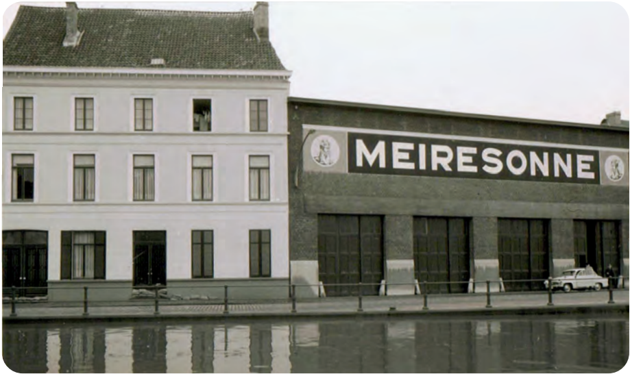
Afb. 5. In de winter van 1966, het jaar van het overlijden van Aimé Meiresonne, werd de brouwerij bedreigd door het wassende water van de Schelde. Links: twee huizen voor het hoger personeel van de brouwerij. De bewoners hebben de onderkant van hun deur al beschermd met zandzakjes. (Verzameling Ph. Bockstaël). Het overstromingsgevaar zou vanaf 1969 verdwijnen met het opstellen van de Gentse Ringvaart en bijhorende sluisen.