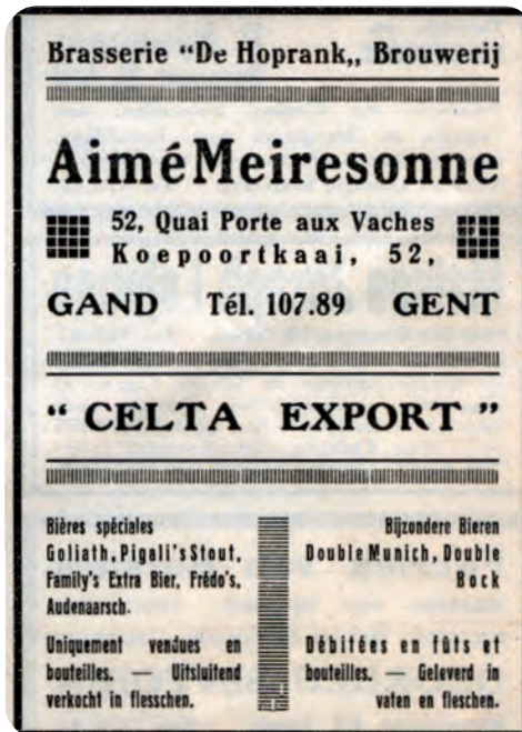
Afb. 6. Met zijn Celta Pils had Meiresonne na 1935 en vooral na de Tweede Wereldoorlog een groeiend succes.