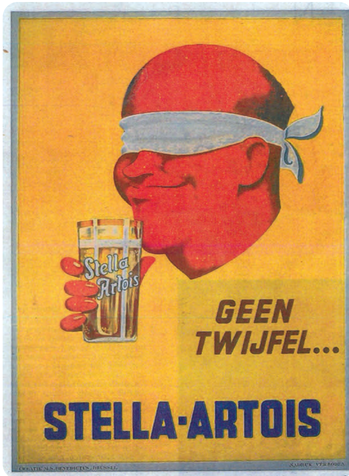
Afb. 1. Vooral vanaf de twintigste eeuw speelde een uitgekende marketing een steeds grotere rol in de promotie van biermerken en biersoorten. De naam Stella werd gelanceerd in 1926.

Het pilsbier van brouwerij Artois in Leuven kende tussen 1962 en 1973, een periode van algemene economische expansie, een exponentiële groei en werd marktleider in België. In dezelfde periode nam Artois tal van andere brouwerijen in Vlaanderen over, onder meer Jack-Op in Werchter en Mena in Rotseelaar. In Nederland verwierf ze de Dommelsche Bierbrouwerij. Het populaire pilsbier, dat zijn oorsprong vond in Beieren en Tsjechië, had toen al een hele geschiedenis achter de rug, die nog voor de Eerste Wereldoorlog begon.