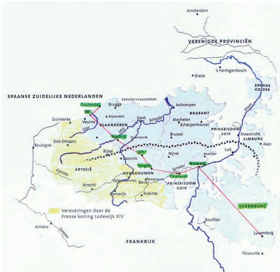
Afb. 1. Vanaf 1643 voerde Lodewijk XIV heel wat aanvallen uit op de Spaanse Zuidelijke Nederlanden. Hierbij veroverde hij een deel van het grondgebied in het zuiden (zie geel gekleurd gebied). In het groen aangeduid en verbonden door een rode lijn: de barrièresteden. De driehoekjeslijn geeft de aloude taalgrens weer. N: Nieuwpoort. Kaartje in bewerkte vorm overgenomen uit Raskin, 2012, De taalgrens of wat de Belgen zowel verbindt als verdeelt , Leuven, Davidsfonds, p. 101.

mond, Venlo, Geldern en Land van Kessel naar de Maas(kant). (afb. 2) Alsof de blijvende sluiting van de Schelde en de hoge belastingen nog niet erg genoeg waren, draaiden de Oostenrijkse Nederlanden op voor de kosten (1,2 miljoen Hollandse florijnen) van de in de barrièresteden verblijvende Oostenrijkse en Staatse (Noord-Nederlandse) soldaten. Die telden in totaal 30 à 35.000 manschappen.