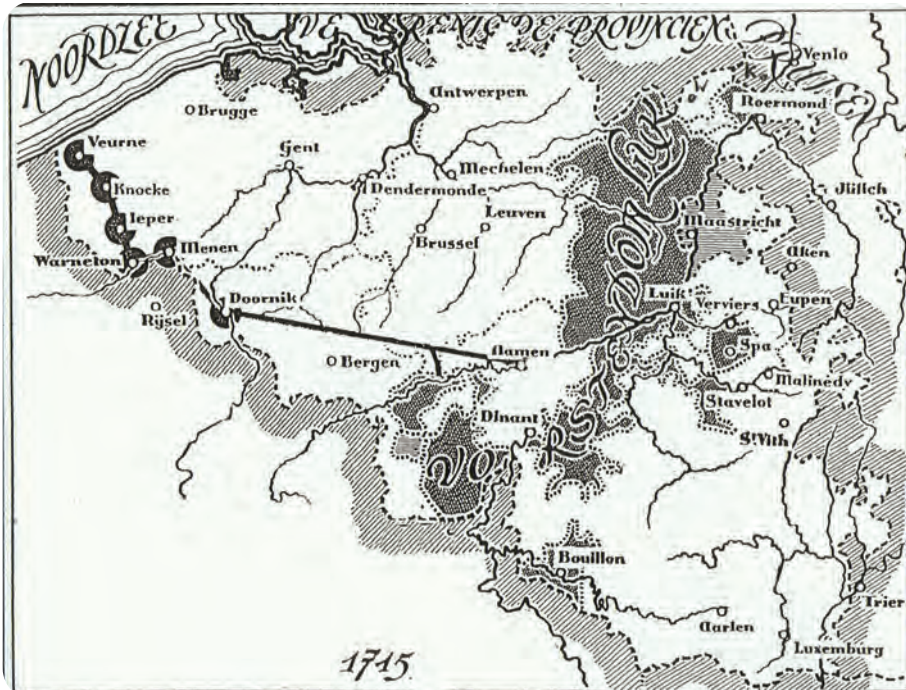
Afb. 2. De nieuwe barrière van 1713/1715 liep van de Noordzee via Doornik en Namen naar de Maasvallei in het noordoosten. Licht gewijzigd en aangevuld overgenomen uit: Pirenne, s.d., Geschiedenis van België . Deel 3, p. 76.

Zowel bij het eerste als het tweede barrièretraktaat streefde de Nederlandse Republiek naar een verdedigingsgordel van elkaar versterkende garnizoensteden. De eerste gordel liep van de Noordzee naar Luxemburg in het zuidoosten. De tweede liep vanaf Veurne via Namen naar het noordoosten. (afb. 1 en 2)