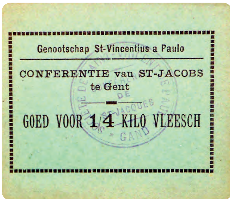
Afb. 3. Goed voor een kwartje kilo vlees, zeldzame luxe voor velen.