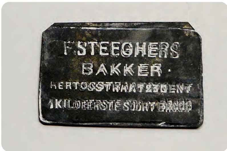
Afb. 2. Metalen broodplaatje voor het identificeren van het armenbrood. De bakkers drukten dit in het gerezen deeg voor het bakken.