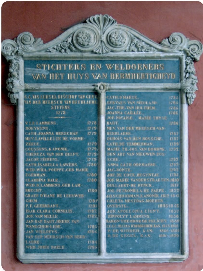
Afb. 10. Gedenkplaat met namen van weldoeners in de open doorgang van het schuttershuis, die toegang geeft tot de binnentuin en de Cultuurkapel Sint-Vincent (foto Fr. Vanderstraeten, 2010, collectie DSMG, Begijnhof, Sint-Amandsberg).

toepasselijk toegewijd aan Sint-Vincent. Toen het OCMW aan nieuwe bestemmingen dacht, werd de intussen sterk vervallen kapel zorgvuldig gerestaureerd en eind 1999 in gebruik genomen voor allerlei culturele activiteiten (afb. 11).