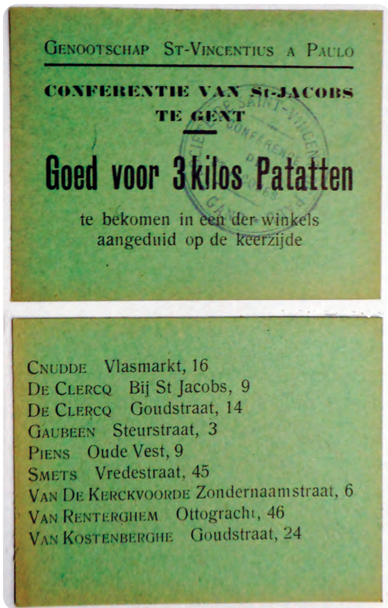
Afb. 4. Patatten, hét armemensvoedsel in de 19de eeuw, kon met zo'n bon (hier recto en verso) in de Sint-Jacobsparochie in de aangegeven voedingswinkeltjes verkregen worden.