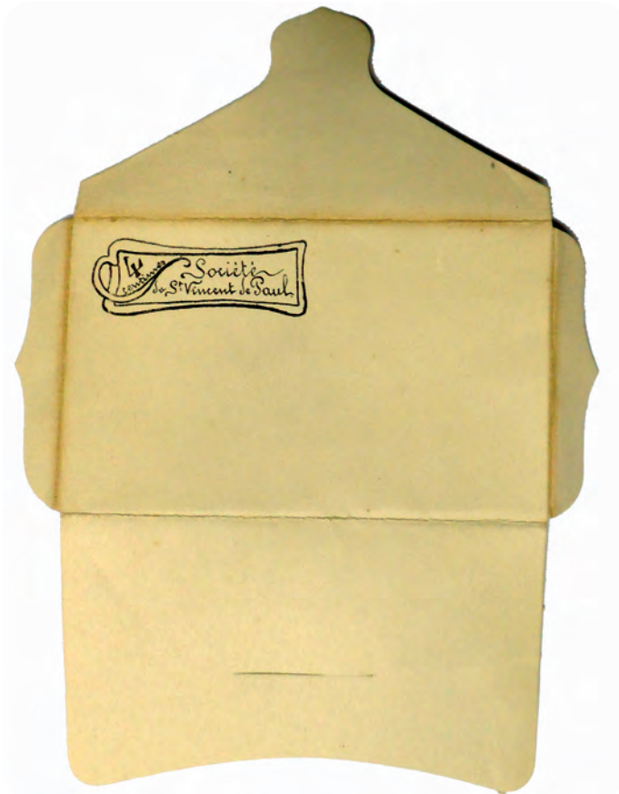
Afb. 5. Alles was ordentelijk georganiseerd, voor de top in het Frans.

niem, 1849), geeft een goed beeld van hoe dit ontstond. ‘De Stad Gent, in haere verstandige bezorgdheyd voor de arbeydende klassen, heeft gemeentescholen gesticht, waer duyzende kinderen de weldaden van het onderwijs ontvangen’. Maar dat onderwijs duurde slechts vier tot vijf jaar. Verder citerend: ‘Maer tot den jongelingstyd gekomen ontsnapt het kind, dat door goede leermeesters tot de wetenschap en de deugd is opgeleyd, aen hunne werking, en bevindt zich eenigerwijze aen zich zelve overgelaten; de invloed zyner familie is dikwyls weynig heylzaam, want het kind ontvangt niet altyd het voorbeeld en den raed, die het in ’t goede kunnen houden; en aldus vergeet het kind van den werkman, overgeleverd aen zyne eygene neyging, ter prooy aen ontberingen en ellende, de goede lessen der school en gaet maer al te dikwyls het getal der landloopers, somtyds zelf dat der misdadigers, vermeederen.’