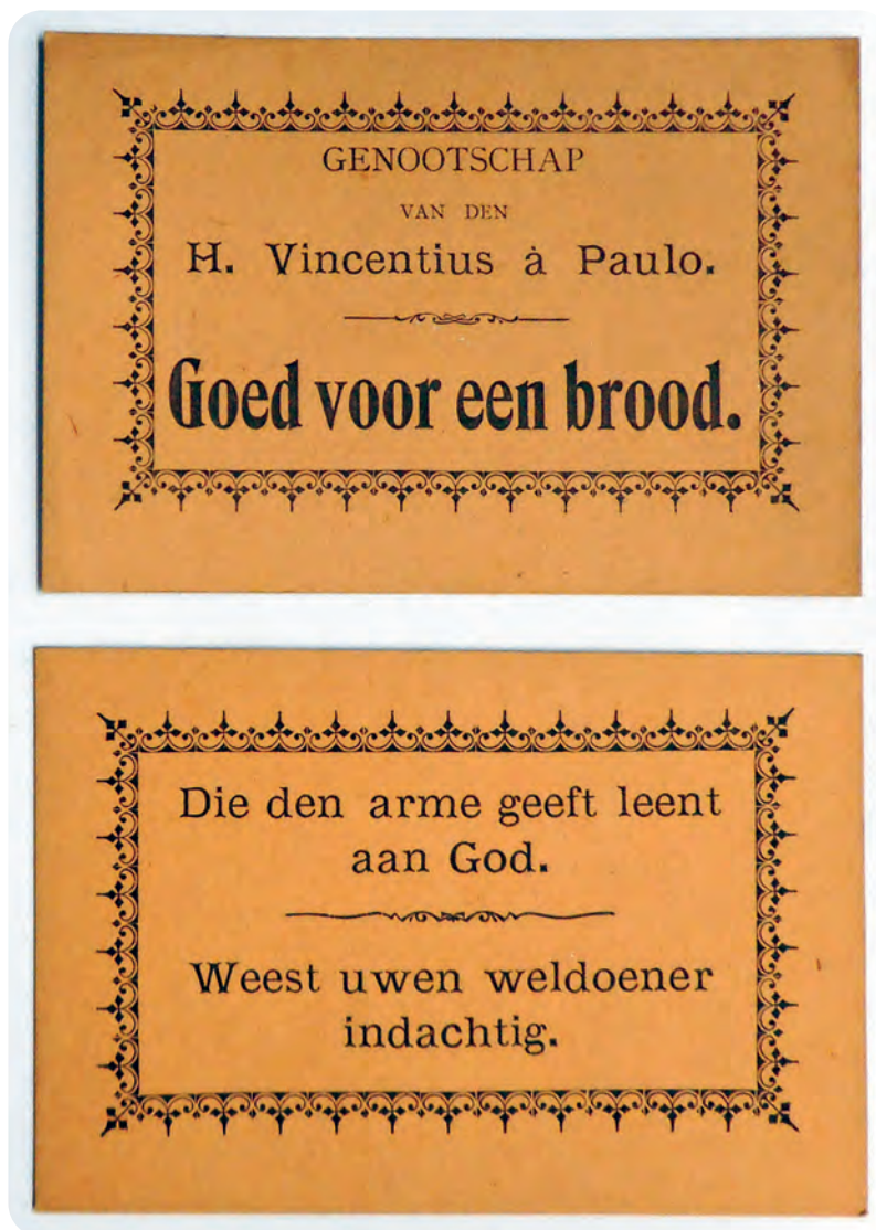
Afb. 1. Met zo'n broodbon (recto en verso afgebeeld) konden armen bij welbepaalde bakkers een gratis brood krijgen.

Een interessant, hieronder uitgebreid geciteerd krantenartikel over een geldinzameling bij de 'Nyverheidstentoonstelling van Vlaenderen' te Gent (Ano-