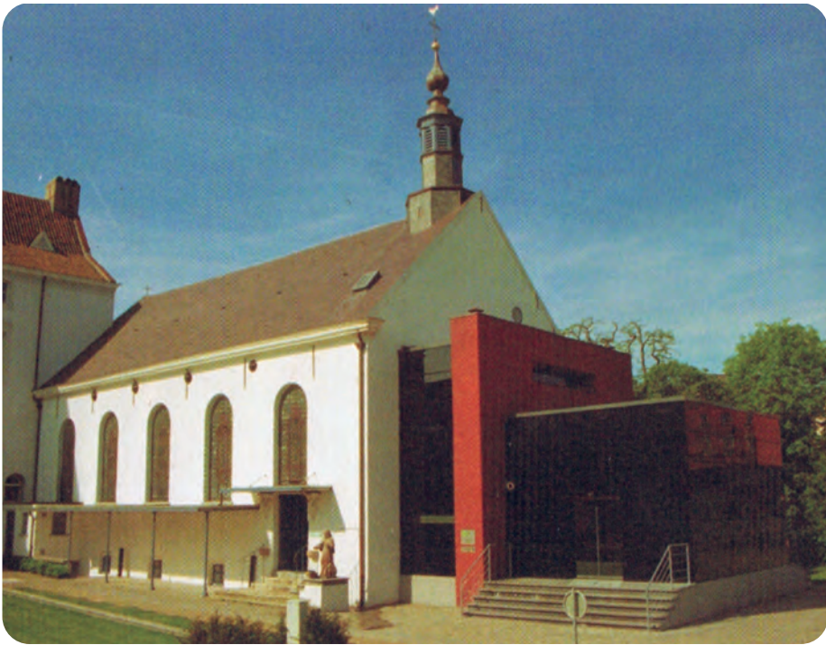
Afb. 11. De Sint-Vincentkapel (links) aansluitend bij het gildegebouw van het schuttersgilde aan de Sint-Antoniusskaai. Het beeld naast de ingang van de kapel is dat van Sint-Antoniüs ‘met zijn zwijntje’.

De Vincentianen bekommerden zich ook om de ziekenzorg. De Sint-Vincetiuskliniek van de zusters van Liefde aan de Fabrieksplaats bij de Groenebriel herinnerde lange tijd aan dit belangrijke onderdeel van de Gentse samenleving. Samen met de kliniek Heilige Familie van de ‘spinnestekes’ (josefienen, een armere vrouwelijke kloosterorde) en de in oorsprong socialistische Volkskliniek werd dit omgevormd tot Academisch Ziekenhuis (AZ) Sint-Lucas. Daarmee verdween de heilige uit die vroeger pittoreske, maar heel arme buurt. Het dichtbijgelegen instituut voor verpleegkunde aan de Molenaarstraat heet officieel IVV Sint-Vincentius, maar is als zodanig weinig gekend. In Gent houdt vooral de Cultuurkapel Sint-Vincent op de Sint-Antoniusskaai de naam nog levendig.