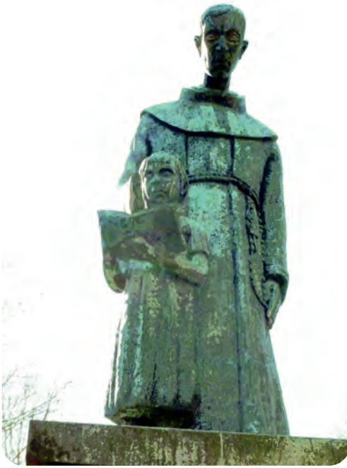
Afb. 7. Pedro da Gante. Kopie op het Fratersplein van het standbeeld door het provinciebestuur van Oost-Vlaanderen in 1975 geschonken aan Mexico-City. Werk van beeldhouwer Albert De Smedt uit Sint-Niklaas en brongietterij Vindevogel, Zwijnaarde (foto 2019). De naam van het pleintje refereert naar de broeders van de ‘derde orde van Franciscus’ die daar in de middeleeuwen verbleven.

komst van de steden. Eenvoudig gesteld: het stijgend belang van handel en nijverheid ging samen met een relatieve stagnatie van de rurale samenleving waarin de in oorsprong Merovingische abdijen functioneerden. De heren (domini) benedictijnen bleven wel bestaan en ze dragen tot op heden de titel Dom (dominus). De nauwelijks minder feodale, maar wel beter georganiseerde cisterciënzers en norbertijnen hielden beter stand. De stedelijke kloosters van franciscanen, dominicanen en andere, namen echter religieus en intellectueel gezien het voortouw.