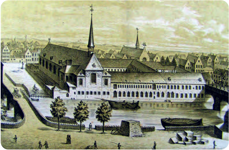
Afb. 1. Minderbroedersklooster in 1770, nu Oud Gerechtsgebouw op de Walmeere, nu Koophandelsplein (aquarel door Aug. Van den Eynde naar schilderij van Augustin Cnudde, De Zwarte Doos, Archief Gent, Atlas Goetghebuer). Links, naast de kerk, een 'gewad' (wad): veedrenkplaats met een paaltjesafsluiting bij de Leie om dieren te verhinderen te ver in het water te gaan of zwemmend te ontsnappen. Achterin: de Schipperskapel met torentje en een miniatuur (?) zeilschip bovenop de puntgevel aan de straat. Rechts de Kuipgaten, een zwaar gebouwde en hoge stuwbrug: als brug enkel bruikbaar voor voetgangers: het brugdek komt ter hoogte van het kloosterdak. Op de voorgrond midden: een stapel bakstenen en rechts enkele zware blokken natuursteen. De Recollettenlei fungeerde blijkbaar als klein haventje voor bouwmaterialen

den ook de dominicanen in 1228 een klooster oprichten vlakbij genoemde parochiekerk in Onderbergen in de wijk Overleie. Beide kloosterstichtingen behoren daarmee tot de eerste stichtingsgolf in de Nederlanden (1225-1250), toen er bijna uitsluitend franciscaanse en dominicaanse kloosters worden opgericht. Vanuit Zuid-Frankrijk en Noord-Italië kenden zij met pauselijke steun een snelle verspreiding in de steden over heel Europa.