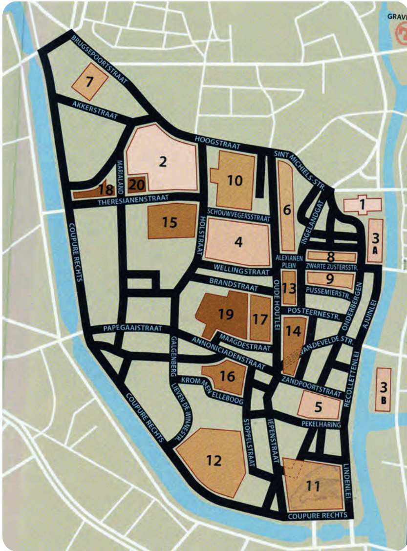
Afb. 4. Deze schematische weergave van een stadsgedeelte met religieuze stichtingen geeft een idee van de dichtheid ervan binnen de stad: hier in de wijk die wellicht nog best Overleie kan genoemd worden (een in Gent niet gebruikte naam), maar die door een zeer actieve buurtgroep de naam Papegaaivijk opgespeld kreeg (uit: De Winter & Erauw, 2017). De locatie van het minderbroederklooster op de andere Leieoever werd eraan toegevoegd (3b). De lichtere kleuren duiden de oudere stichtingen aan, met als oudste: nr. 1 Sint-Michielskerk (ca. 1000) en nr. 2 Rijke Gasthuis (1146). In de dertiende eeuw: nr. 3a dominicanen, nr. 3b franciscanen, nr. 4 begijnhof Poortakker en nr. 5 bogaarden bij de Zandpoort. In de veertiende eeuw: nr. 6 begraafbroeders (schokkebroers, celledroeders, later alexianen), nr. 8 grauwezusters en nr. 9 zwarte zusters. In de vijftiende eeuw: nr. 10 zusters van Galilea, nr. 11 agneetklooster en nr. 12 priorij van Waarschoot.