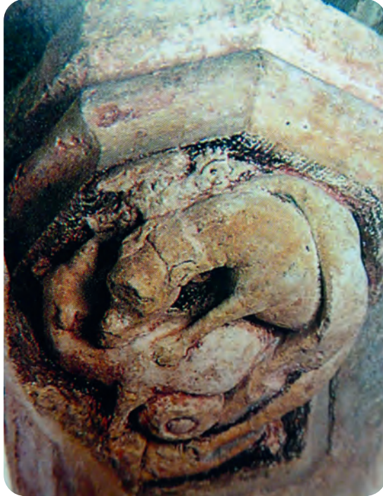
Afb. 3. Een hond bijt de hals over van een serpent (symbool van het kwade): uitbeelding van de strijd die de dominicanen (volksetymologisch Domini canes: honden van de Heer) leverden tegen de katharen (de 'zuiveren'): oorsprong van het woord ketter ... en van de dominicanen-orde zelf. Kraagsteen (begin 15de eeuw) in het lavatorium van het Gentse klooster in Onderbergen, destijds vermoedelijk beschilderd met felle kleuren (overgenomen uit Simons e.a., 1990).