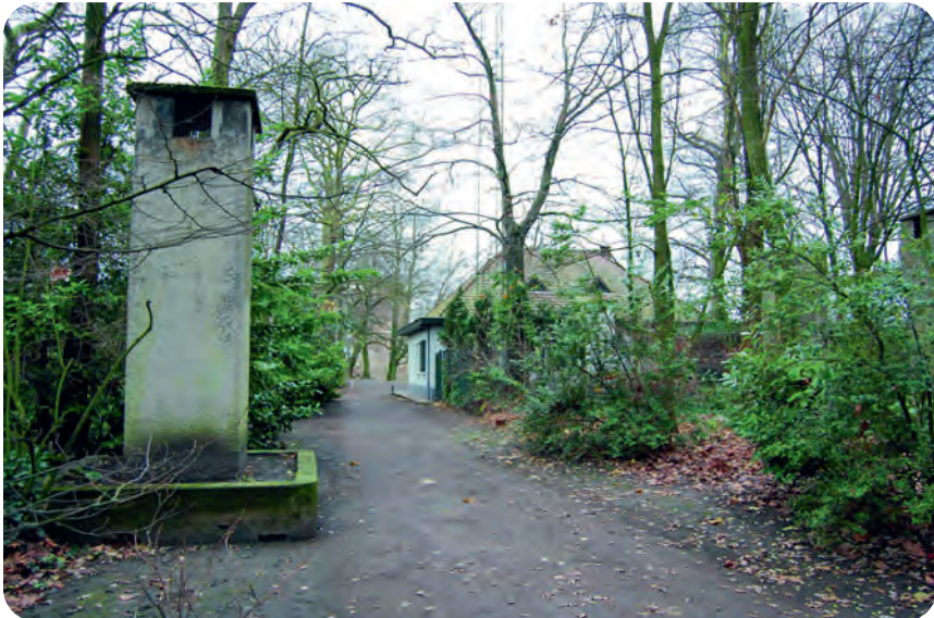
Afb. 6. Recent gezicht vanuit hetzelfde standpunt, cf. afbeelding 4.