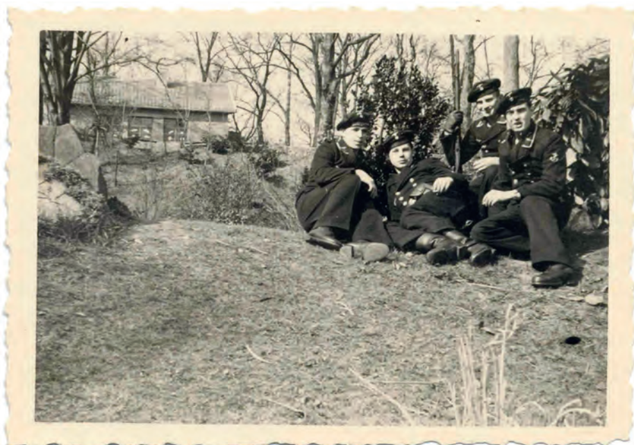
Afb. 1. Marine soldaten van de 3/1. Funkmess-Abteilung poseren in maart 1944 voor een groepsfoto met in de achtergrond het toegangsgebouw tot de ondergrondse commandobunker.

Aanvullend bij het artikel van Ghislain (Guy) Mineur, wordt een korte schets gegeven van de bouw en de functie van de schuilplaatsen die kort voor en tijdens de tweede wereldoorlog gebouwd werden in en bij het Citadelpark. Daarnaast worden de opeenvolgende Duitse bezettingstroepen in de Leopoldkazerne opgesomd en geïllustreerd.