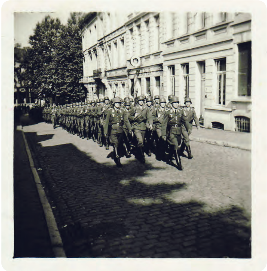
Afb. 7. Rekruten van het 22. Flieger-Ausbildungs-Regiment in vol ornaat in de Laurent Delvauxstraat op weg naar de Leopoldkazerne ( collectie G. Antheunis ).