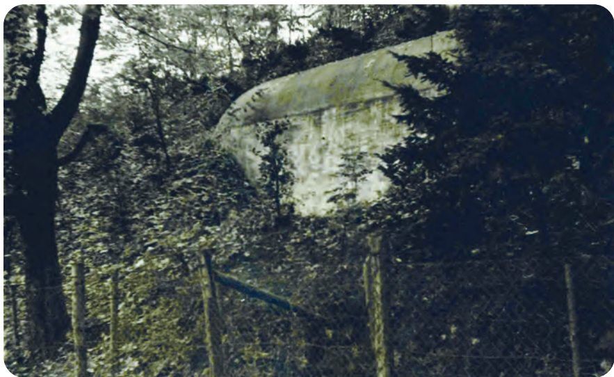
Afb. 3. In het talud van een van de parkdreeven kan men tot op vandaag -naast de nog aanwezige militaire structuren in de omgeving- een klein stukje van de ondergrondse bunker zien. Toestand 1941. Na de Tweede Wereldoorlog werd de bunker tot eind jaren 1980 gebruikt door de Civiele Bescherming, vanaf 1993 overgedragen aan de Stad Gent ( collectie G. Antheunis ).

tier van de '1. Marine Funkmessabteilung' (afb. 1 en 2). Het gedeelte van het Citadelpark bij de bunker was 'Sperrgebiet' en in 1941-1942 werden er verscheidene schuilplaatsen, munitiemagazijnen en andere militaire constructies toegevoegd (afb. 3). Het door de Duitsers uitgebreide bakstenen toegangsbouw, het café-restaurant 'Chalet Suisse' en andere militaire constructies werden in september 1944 in brand gestoken (afb. 4 & 5).