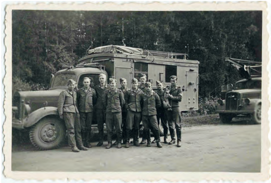
Afb. 2. Soldaten in het Citadelpark met een Funkwagen van de 10. Kompanie Luftnachrichten von Belgien und Nord-Frankreich. Deze eenheid nam vanaf mei 1940 onder meer de commandobunker in bezit.