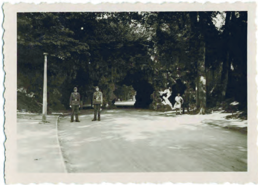
Afb. 4. Twee soldaten van de 10. Kompanie Luftnachrichten von Belgien und Nord-Frankreich poseren voor de kunstmatige grotten in de Louis Minarddreef. Dit waren oorspronkelijk flankerende kazematten van het bastion 5 van de Citadel. Ze werden in 1944 ingericht als schuilplaats.

Vanaf juni 1941 tot midden juli 1942 werd de kazerne bezet door het 22. Flieger-Ausbildungs (opleidings)-Regiment o.l.v. Oberst Wichard (afb. 7 en 8). Vrijwel elke soldaat die koos voor de Luftwaffe, kreeg nog voor hij een vliegtuig van dichtbij te zien kreeg, een militaire basisopleiding. Dit gebeurde doorgaans in een 'Flieger-Ausbildungs Regiment'. In tegenstelling tot wat nogal eens gedacht wordt, waren lang niet alle Luftwaffesoldaten voorbestemd om vliegenier te worden. Een groot deel belandde na hun kennismaking met het militaire leven in opleidingsscholen voor mecaniciens of andere specialismen zoals grondradar en luchtafweer. Op 26 juni 1941 werd het 22. Flieger Ausbildung Regiment plechtig ontvangen op het ereplein van de Gentse Leopoldkazerne. De eenheid kwam uit Warschau, maar was vanaf nu in Gent verantwoordelijk voor de basisopleiding van rekruten van de Luftwaffe. Het Regiment, inclusief staf, administratie en medische afdeling, bestond uit vier opleidingscompagnieën en één compagnie vrachtwagen-chauffeurs.