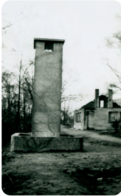
Afb. 5. Gezicht op een luchtschacht en het vernielde toegangsgebouw tot de commandobunker net vóór de restauratiewerken in 1947. ( Stad Gent – Archief Gent )