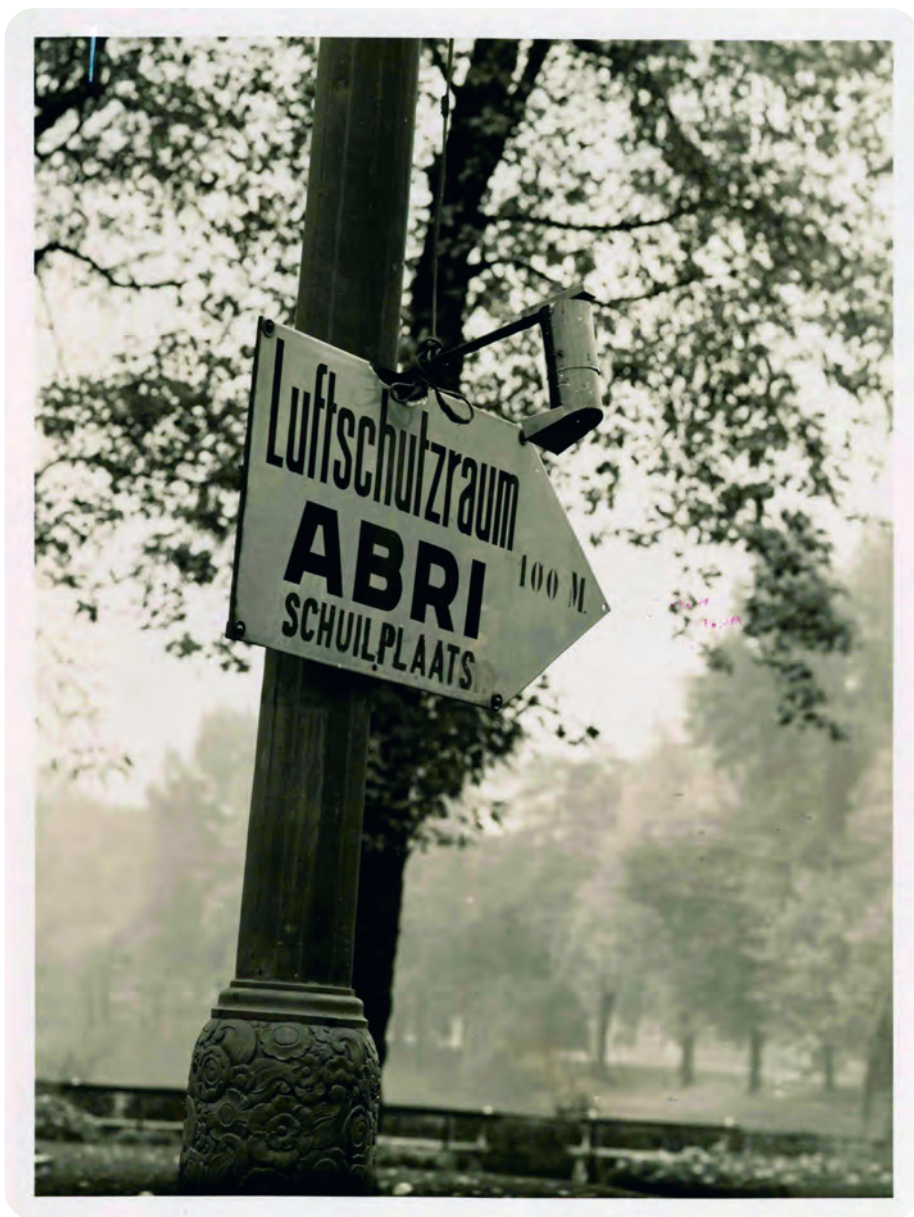
Afb. 9. Duidelijk genoeg in drie talen.