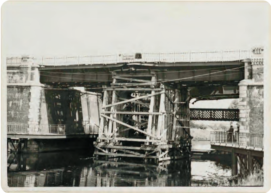
Afb. 3. De Snellespoorbrug werd op 13 mei 1940 zwaar beschadigd door een Duits bombardement op de Sint-Pietersstationswijk. Ze werd zeer snel daarna hersteld door de Eisenbahnbau Kompagnie 101.

In ons huis kregen we in 1940, in april meen ik, bezoek van de Civiele Luchtbescherming. Die mannen kwamen de toestand opnemen en tips geven om de kelder van de achterbouw van ons huis in te richten als schuiloord, een drietal meter onder de grond. Mijn pa ondersteunde de ganse kelder met houten balken: tegen het plafond platte liggers op zware steunbalken er onder. Een keldervenster werd omgevormd tot nooduitgang en vluchtweg via de grote koer. In de muur van de aanpalende kleine koer werd een mangat gekapt. Een schop en een pioche (houweel) stonden klaar voor noodgevallen. Stofmaskers werden door mijn ma gemaakt en de kelder werd voorzien van een noodlicht met batterijen, later vervangen door een tweetal handdynamo's met lamp. Het schuiloord werd meermaals gebruikt door ons en de geburen (10 à 12 man): bij de bombardementen op Merelbeke (1) en de nachtelijke beschietingen door de Duitsers na de bevrijding van Gent op 6 september. Iedereen had een deken bij tegen de koude en een kussen te gebruiken als bescherming tegen vallend vuil en als extra een stofmasker. Wat een toestanden!