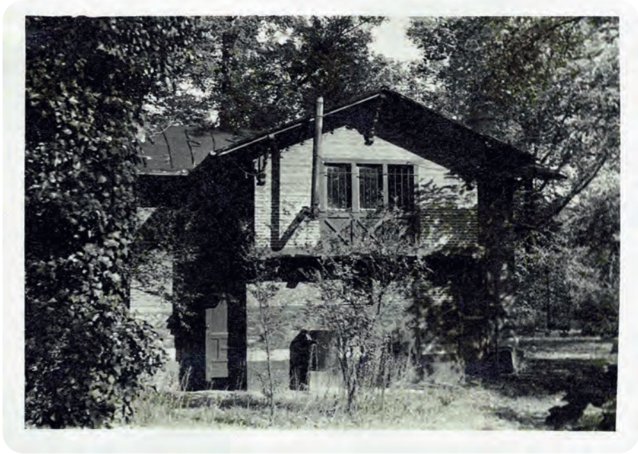
Afb. 1. Toestand van het 19de-eeuwse Chalet Suisse in 1941. Deze cafetaria voor parkrecreanten werd gebouwd bovenop een oude kazemat van de originele Citadel uit de Hollandse tijd. De onderaardse kazemat was in gebruik als 'koele berging' en opslagplaats voor dranken. Deze kazemat kreeg als bunker de functie van militaire schuilplaats bij luchtaanvallen in het Citadelpark (collectie G. Antheunis).

afvoer van boeken tussen de nieuwgebouwde Boekentoren en de leeszaal beneden. Ook een aantal kleinere liften per twee verdiepingen moesten geïnstalleerd worden en een grote snelle lift voor 20 personen tot de bovenste verdieping van de toren, 80 meter hoog.