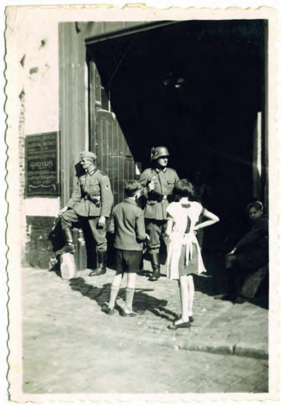
Afb. 9. Toegangspoort van het militaire ziekenhuis aan de Antonius Triestlaan. Van 1940 tot eind 1941 was dit een lazaret waar onder meer Belgische krijgsgevangenen verzorgd werden. Op de achterzijde van deze foto staat: 'Der Papa beim kontrollieren der Strassenjungs vor einen gefangenenlazarett in Gent.' (Collectie G. Antheunis).

De door de Duitsers geplande invasie op Engeland vanuit Frankrijk mislukte, mede doordat de grootse voorbereiding van de invasievloot tijdig werd ontdekt door de R.A.F. Nadat de uitvalsbasis platgebombardeerd was, voerde men zeer zwaar verbrande soldaten, die in Frankrijk niet konden verzorgd worden, per ziekenwagens en camions, onder andere naar Gent. Al huilend werden ze binnengereden via een zijtoegang van de Triestkazernes, later politiekantoren, bij Ekkergermerk (afb. 9). Dat gebouw deed dienst als militair 'Krankenhaus' (3). Ik passeerde er met mijn pa, die liften aan het plaatsen was in de nieuwe Landbouwhogeschool vanaf 1937 gebouwd aan de Coupure (afb. 10). Ik was er getuige van hoe de voertuigen met schreeuwende soldaten binnenreden: zwartgeblakerde mannen. Dit heb ik met eigen ogen en oren gezien en gehoord. Vreselijk! Tot heden nergens op papier te lezen gekregen.