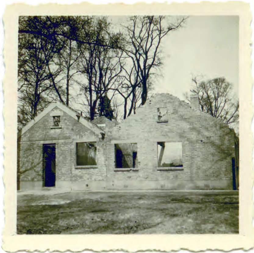
Afb. 16. Het uitgebrande toegangsblok van de ondergrondse commandobunker. Na de herstelingswerken en verbouwingen werd het bouwsel aan het einde van de veertiger jaren samen met de bunker in gebruik genomen door de Civiele Bescherming.

Op zaterdag 2 september zag ik hoe de cafébaas van De Karper 'zich ontfermde' over een achtergelaten Duitse motorfiets met sidecar die voor zijn deur