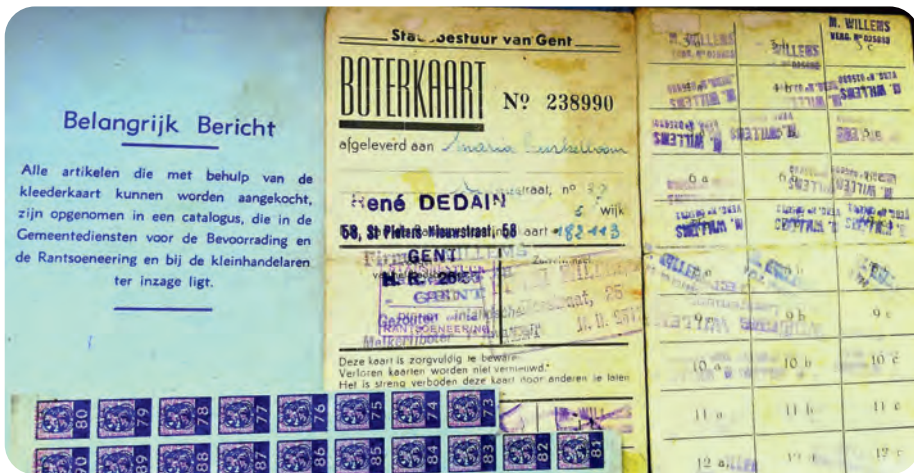
Afb. 12. Rantsoenkaarten en -zegels (schenking Turkelboom – Audoor in DSMG Vliegende Bladen – Gent, Reeks oorlog). Deze exemplaren dateren van kort na WO II, toen het systeem nog een paar jaren in voege bleef.

Enkele keren is mijn ma, na lang aanschuiven, met vlooiën teruggekeerd. Nogmaals: wat een tijd! De rantsoeneringskaart werd nog voor de oorlog ingevoerd (tussen 18 en 23 maart 1940). Iedereen ingeschreven in het bevolkingsregister ontving er een. Voor ons gezinnetje waren dat vier kaarten. Het systeem is pas vanaf 15 februari 1947 geleidelijk gaan verdwijnen, eerst de vleesbonnen, daarna die op het brood (2 november 1948). De rantsoenering stopte definitief op 15 januari 1949.