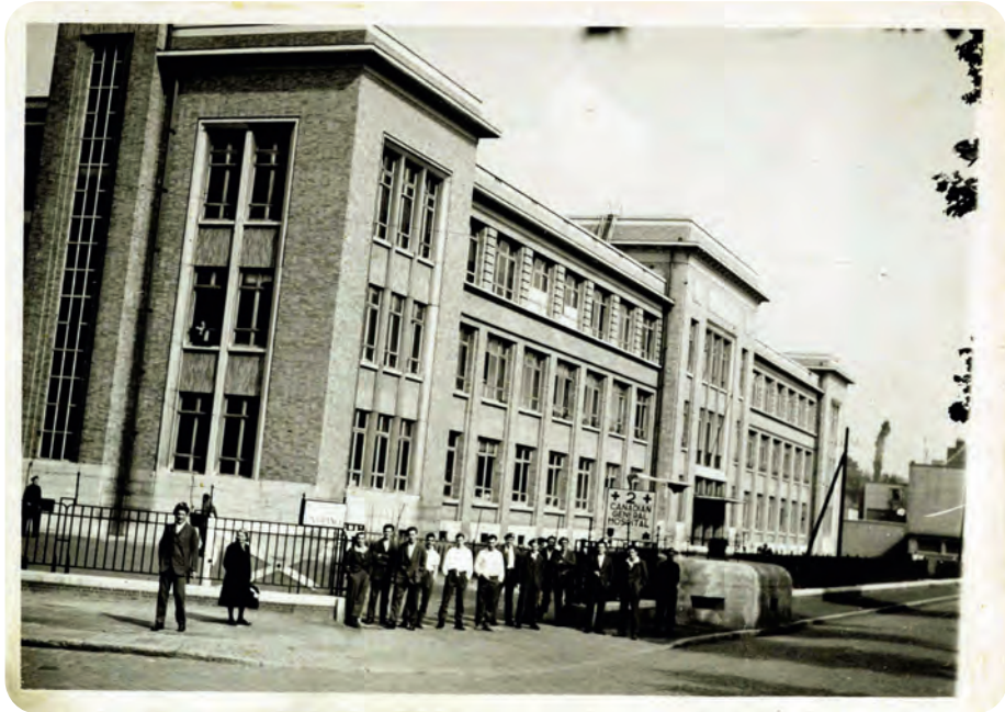
Afb. 10. De pas gebouwde Landbouwhogeschool aan de Coupure Links in 1945, toen de gebouwen door de Canadezen als veldhospitaal gebruikt werden. Op de voorgrond ziet men nog een Duitse observatiepost. Tijdens de oorlog werd de Landbouwschool onder meer ingenomen door Heeres-Kraftfahr-Park 522 en de Heeres-Unterkunftverwaltung: legervoertuigenpark en dienst voor legerhuisvesting.