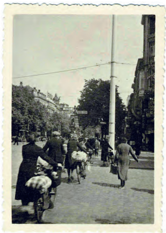
Afb. 6. Koningin Elisabethlaan, terugkeer in juni 1940 van Gentse vluchtelingen.

De avond aangebroken, zochten we naar overnachting en vonden we onderdak in een café tegen de rand van een bos. Dat zat al volgepropt met vluchtelingen. Ik heb die nacht op de schoot van moeder geslapen, mijn hoofd op een cafétafel. Ik zie het nog voor mijn ogen. Tussen 4 en 5 u. 's morgens gebonk op de cafédeur: Duitsers zochten naar Franse soldaten. Ze controleerden alles,