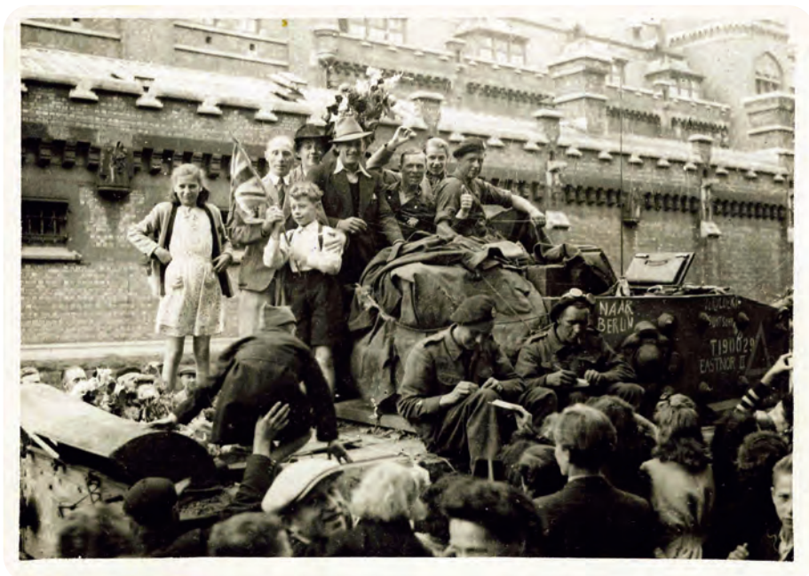
Afb. 14. Enthousiaste Gentenaars verwelkomen hun Britse bevrijders aan de Leopold kazerne.

Als ik me goed herinner vertrokken op donderdagnamiddag 31 augustus 1944 (en geen school) de Grijs Muizen die logeerden aan de Charles de Kerkhovelaan met pak en zak. De volgende dag 1 september '44, een vrijdag, doorkruisten meer en meer konvoien Duitse soldaten de stad. Blijkbaar de achterhoede. Toen was het meisjesatheneum al een tijdje ontruimd.