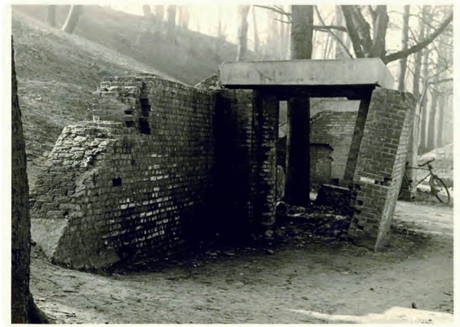
Afb. 15. Vernielde toegangsblok op de Leopold II-laan die verbonden was met de ondergrondse structuren achter het podium van het openluchttheater in het Citadelpark (Stad Gent – Archief Gent).

Na de bevrijding ging ik kijken via de grote zijpoort van deze hall. Wat ik zag was één grote garage met opgeëiste auto's en camions. Deze waren door de