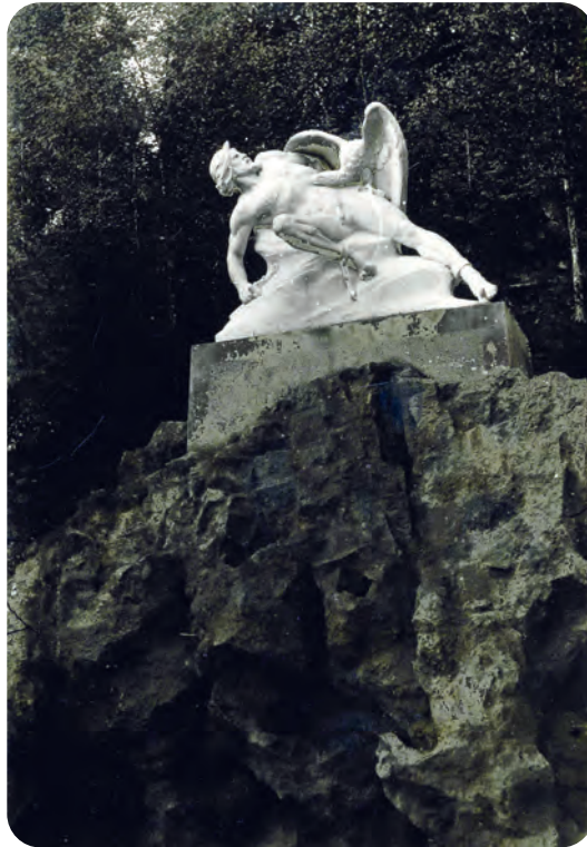
Afb. 2. ‘Prometheus’ door Lodewijk Van Biesbroeck, onthuld in 1889; het beeld werd tijdens de Tweede Wereldoorlog beschadigd en verdween nadien op mysterieuze wijze. Nu staat in het verlaten en bemoste openluchttheater tegen de helling achter de scène alleen het stomme voetstuk met stilaan afbladderende cementbezetting.

Eind 1939 was er mobilisatie van het Belgisch leger, met heel wat militair gedoe aan en rond de Leopoldkazerne. Daar liepen soldaten alsmaar over en