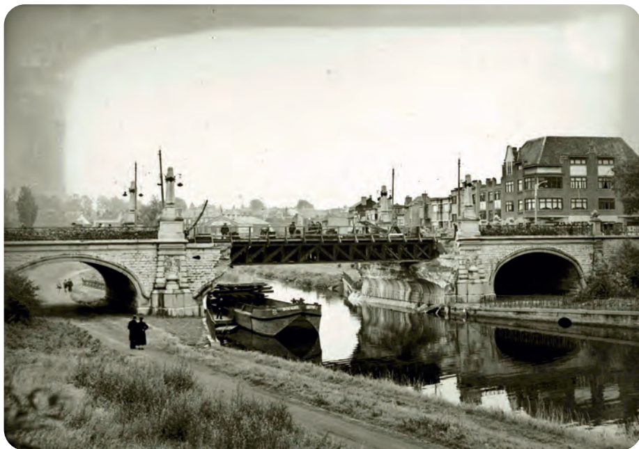
Afb. 4. De noodbrug voor de door Belgische troepen opgeblazen Koning Albertbrug.