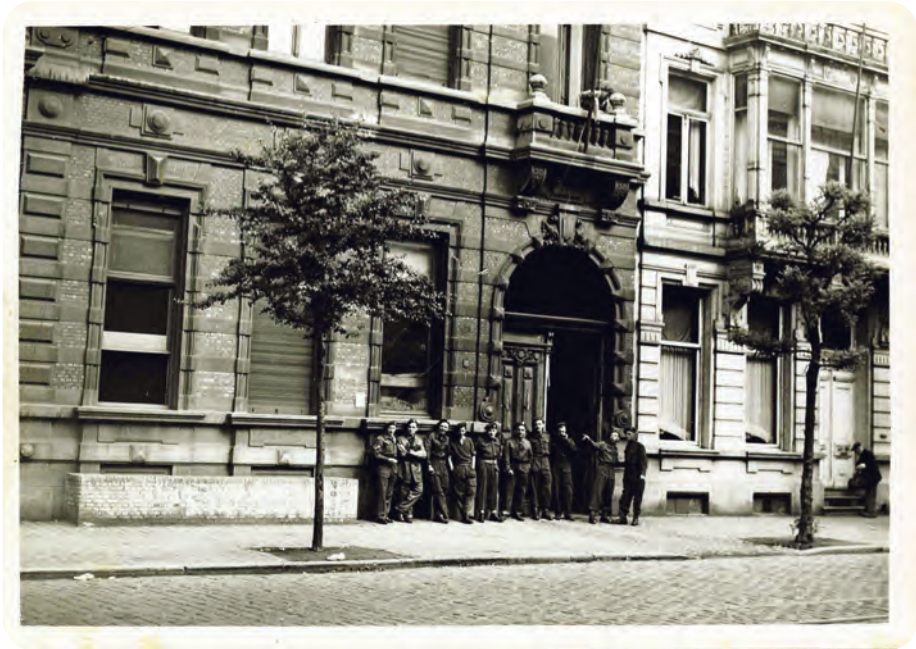
Afb. 17. Het Lyceum aan de Kortrijksesteenweg werd na de bevrijding bezet door Britse soldaten.