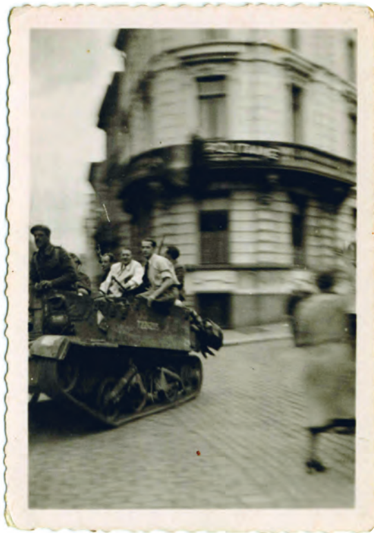
Afb. 13. September 1944, een Bren Gun Carrier -licht pantservoertuig- met leden van het Gentse Verzet en Britse soldaten op de Charles de Kerchovelaan ter hoogte van de Laurent Delvauxstraat (collectie G. Mineur).

half 1943 langs beide kanten voorzien van Friese ruiters. Ook zag men op de Leopoldlaan langs het park ter hoogte van de Marnixstraat, een bakstenen ingang, model schuilkelder, aan beide kanten open. Die was blijkbaar verbonden met het achterste deel van het podium van het openluchttheater, of meer waarschijnlijk met een schuilplaatsingang boven op de berg van het Chalet Suisse en mogelijks met een restant van een demi-lune, onderdeel van de vroegere Citadel. Dit is nog niet exact achterhaald; maar wel meer dan waarschijnlijk.