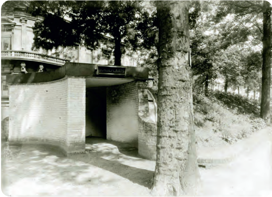
Afb. 8. Toegangsblok van de schuilbunker op de Charles de Kerchovelaan. Deze schuilbunker werd in juli 1943 in gebruik genomen en bood plaats aan 225 personen.

De territoriale- en burgerwachten waren al voor de oorlog samen met de luchtbescherming een schuilkelder voor 250 man aan het graven onder de hoge kastanjabomen van de Charles de Kerchovelaan. Die werd pas in '42-'43 afgewerkt met een dubbele ingang, kant Kortrijkse poort aan het begin van de laan (afb. 8). In totaal werden 23 schuilplaatsen in Gent gebouwd, goed voor 4.730 mensen, heb ik later vernomen. (2) De omgeving dicht bij de commandobunker was nog niet afgezet met prikkeldraad. We konden daar vrij lopen op een pad rondom het openluchttheater.