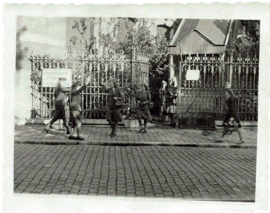
Afb. 11. Luftwaffe Nachrichtenhelferinnen of Blitzmädel -bij Gentenaars bekend als Grijs Muizen- verlaten hun kantoren in de Leopoldkazerne.

‘Coiffeur pour Dames et Parfumerie de France’ op de Brabantdam.