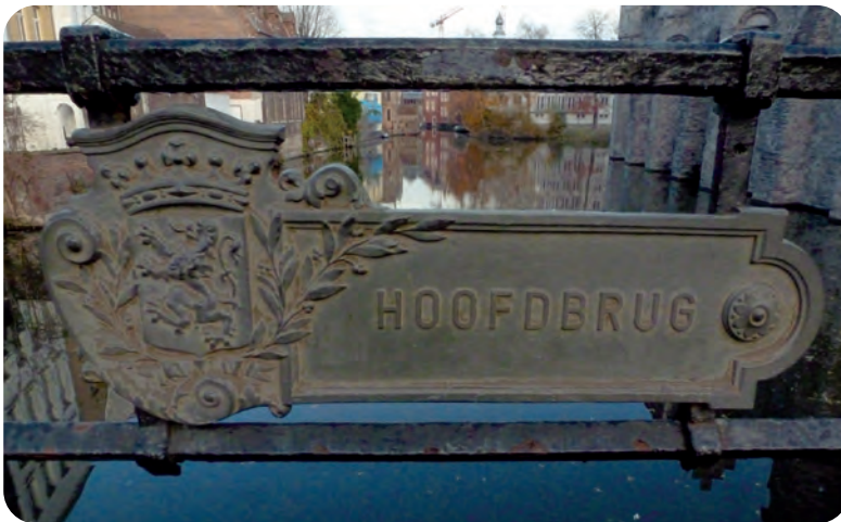
Afb. 1. Het gaat hem hier wel degelijk om de Hoofdbrug en niet om de ‘Onthoofdingsbrug’ zoals de volksetymologisch vervormde naam luidt (foto 2019).

De Burgstraat is een oude Gentse straat. Maurits Gysseling vond een vermelding als Borcstrate in 1241 en meerdere noteringen van de naam nog in dezelfde eeuw (1). Het kan niet anders of er moet wel een poort geweest zijn die