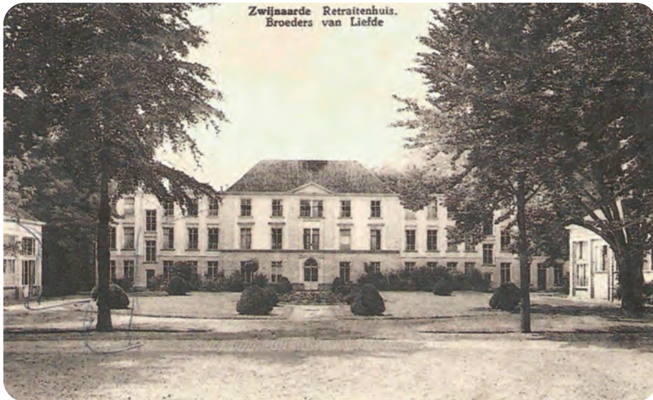
Afb. 7. Het door de broeders tot 'Retraitenhuis' uitgebreide kasteel De Blekerij in neoclassicistische stijl (postkaart 1931).

de grot in de vorige eeuw zouden gebouwd hebben of die meehielpen met de bouw, wellicht tijdens het Interbellum. Dit zou betekenen dat de grot pas tot stand kwam nadat de Broeders van Liefde het domein in 1921 voor ca. 200.000 Bef kochten. Bouwperiode en opdrachtgevers zijn dus voorlopig niet met zekerheid gekend.