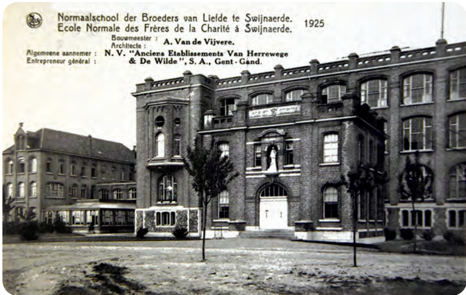
Afb. 8. De Normalschool Sint-Aloysius (postkaart 1925).

nadien, op 27 april 1953, viel het complex ten prooi aan een felle brand. Opnieuw werd het snel hersteld.