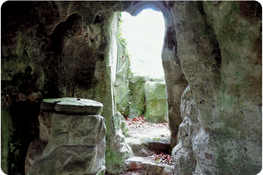
Afb. 3 en 4. De grot op campus De Deyne (foto's ADD, 2018).