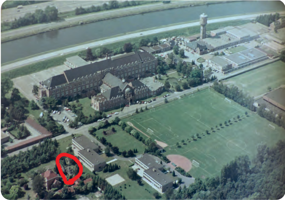
Afb. 11. Recente luchtfoto Campus De Deyne met locatie van de grot bij de oude directeurswoning tussen het geboomte onderaan links.

cludeerd worden dat die er niet was. Zo'n constructie kan immers eerder beschouwd worden als een parkornament dan als gebouw. Daarvoor was trouwens ook geen bouwvergunning nodig.