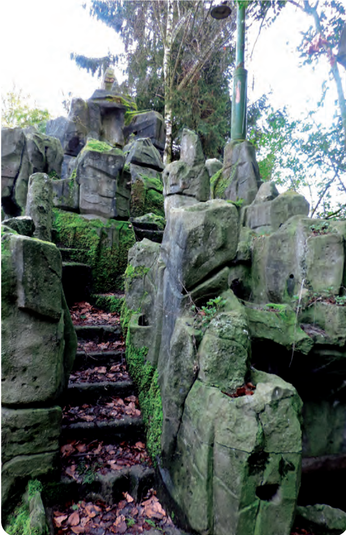
Afb. 2. De grot op campus De Deyne (foto's ADD, 2018).

te, exotische wereld. Deze grotten verschillen sterk van de veel ruimer verspreide en beter gekende ‘Lourdesgrotten’. Deze laatste zijn nabootsingen van de grot waarin Onze-Lieve-Vrouw Onbevlekt Ontvangen zou verschenen zijn bij Lourdes in de Franse Pyreneeën. De grot in Zwijnaarde kende tot op heden een verborgen bestaan. Ze werd niet opgenomen in een beschermd landschap en ook niet in een onroerend erfgoedlijst, zodat wettelijke bescherming ontbreekt.