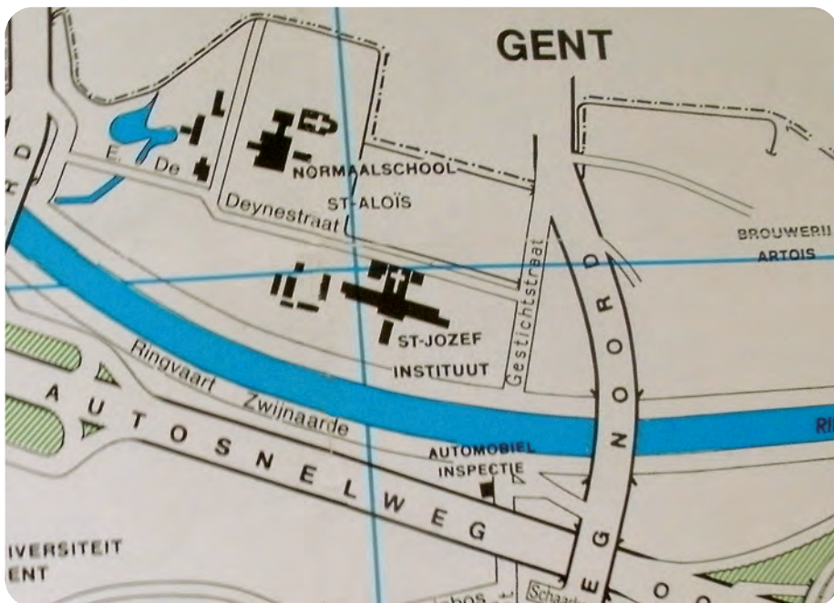
Afb. 9. Lokalisatie van het complex bij de Ringvaart met aanduiding van de twee straten die het geheel toegankelijk maken. Punt - streepjeslijn: de vroegere grens Gent - Zwijnaarde aan de Leebeek, onderdeel van de Rietgrachtgrens (fragment uit kaart Deelgemeente Zwijnaarde. Bijlage bij Kroonblaadje 1988 nr. 2., verzameling A. De Decker).

Twee straten werden genoemd naar het scholencomplex. De Ebergiste De Deynestraat (afb. 9), werd in 1981 genoemd naar broeder Gustaaf De Deyne (kloosternaam Ebergistus), leraar en eerste directeur van de school. Het straatnaambord vermeldt ‘pedagoog, 1887-1943’. De Gestichtstraat hoorde voor het graven van de Ringvaart bij de Heerweg-Noord. De naam verwijst naar het tehuis voor de opvang van zwakzinnige en gebrekkelijke kinderen dat in 1930 verhuisde van de Stropstraat naar deze locatie.