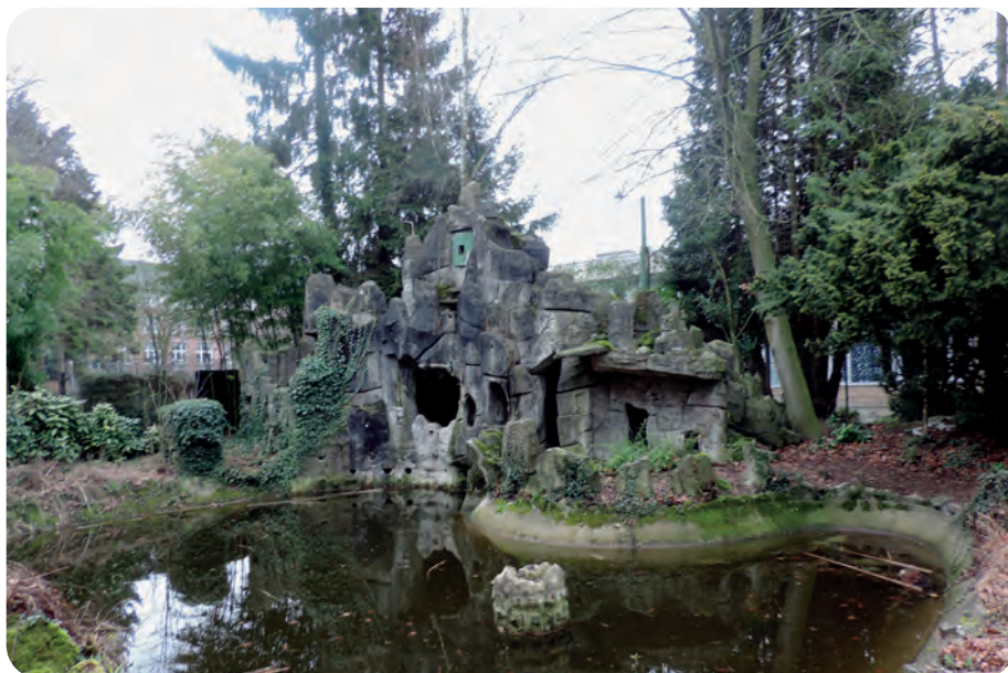
Afb. 1. De grot op campus De Deyne (foto's ADD, 2018).

Op het terrein van de scholencampus De Deyne tussen de wijk Nieuw Gent en de Ringvaart, is een historisch en landschappelijk waardevolle ‘folly’ bedreigd door nieuwbouwplannen van de Broeders van Liefde. Het is een kunstgrot, onderdeel van het gedeeltelijk bewaard gebleven kasteelpark De Blekerij, destijds grondgebied Zwijnaarde. Dergelijke fantastische, op zich volkomen nutteloze bouwsels werden meestal gecreëerd in parken van het Engelse landschapstype. Hoewel volkomen kunstmatig, getuigt ‘cementrustiek’ van een romantisch verlangen naar een ongerep-