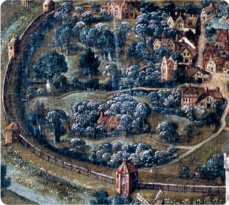
Afb. 4. De bloeiende fruitbomen van de bijngaard, mooi weergegeven op dit detail van het panoramisch gezicht op Gent in 1534 (STAM).

bloeiende fruitbomen. Er waren voor de bestuivers van fruit en groenten ook meer dan voldoende mogelijkheden om water te halen. De dorpsimkers hielden bijen op kleine schaal, maar die leverden hen lekkere en kostbare honing op: zoetmaker voor lekkernijen, zoetigheid en volksmedicijn. De duizenden werksters en hun koningin woonden niet in kassen zoals nu, maar in van stro gevlochten korven. Voor de imkers was dat bewerkelijker, maar de kostbare opbrengst was het werk meer dan waard.