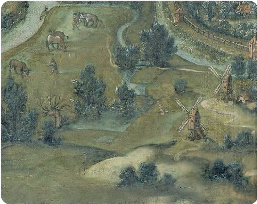
Afb. 1. Uitsnede van 'Gent 1534' met de Grote Heernesse en een deel van de Kleine Heernesse langs de Nederschelde. Ten noorden van de stadsvest uit ca. 1325, rechts op de afb., zien we de prachtige (lust)tuinen, die aansloten bij grote, stenen huizen. Stedelingen met een mooi inkomen investeerden al vanaf de 15de eeuw in buitenverblijven met lusthof. Deze hier lagen vlakbij het centrum en waren zeer gegeerd. De man met de stok is een koeherder.

ming inhield. Dezelfde bescherming en tolvrijheid golden niet enkel de productie van de erkende neringen, maar ook de meest diverse voorwerpen van huisvlijt, bijvoorbeeld mutsen en klompen. Producten van hun huisnijverheid konden probleemloos en tolvrij in de stad verkocht worden. De laatmiddeleeuwse stadsvesten strekten zich immers uit tot voorbij het dorp. De 'Bave-neers' moesten de tolln geheven aan de Spitaal- en Dendermondsepoort niet betalen.