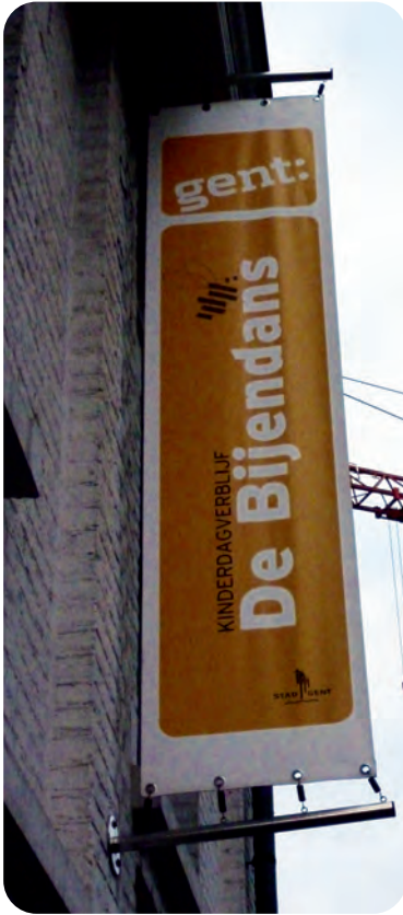
Afb. 7. De bijen maken school: De Bijendans: kinderdagverblijf in het gerestaureerde stationneke van de Buurtspoorwegen aan de Forelstraat (foto 2019).

echter voorbehouden aan de heren, van wie de abt van Sint-Baafs de belangrijkste was. De dorpsbewoners konden in de herfst iets bijverdienen door de vangst en verkoop van kleine trekvogels. Tijdens het jachtseizoen werd dan ook heel wat wild bereid voor de abtstafel. Arme stropers die betrapt werden kregen een fikse boete. Wie niet of onvoldoende kon betalen, kon zijn schuld voldoen met een werkstraf in dienst van de benadeelde heer. Sommige dorpelingen kregen een kleine beloning na het doden van een vos of een wolf, waarvan eerst het bewijs (een poot of een staart) moest ingeleverd worden.