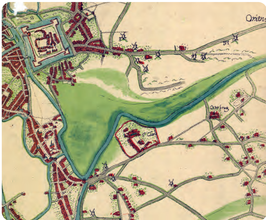
Afb. 2. Detail uit de stadsplattegrond van Gent, tussen 1559 en 1564 met militaire doeleinden getekend door Jacob Roelofs van Deventer, vanaf 1543 koninklijk geograaf en cartograaf van Karel V. Hier is goed te zien dat de Heirnesse (groene zone) min of meer samenviel met de winterbedding van de Schelde. Linksboven het Nieuw (Spaans) Kasteel, een militaire fortificatie die vanaf 1540 werd gebouwd op bevel van de keizer.