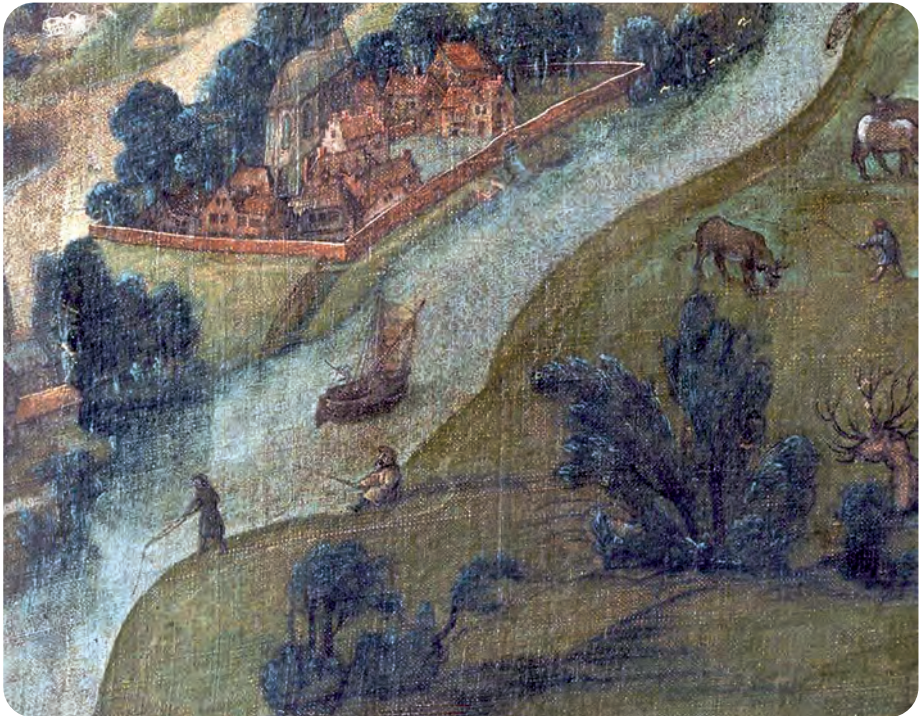
Afb. 8. Twee vissers aan de Nederschelde in de Kleine Heernesse. Aan de overzijde: het oude parochiekerkje van Gentbrugge (detail uit 'Gent 1534').

baseerden de (Baafse) monniken zich niet alleen op oude medische handschriften en op de wijsheid van (Gentse) apothekers, maar ook op de empirische kennis van kruidenvrouwjes en sommige begijntjes. Die kenden ook de (zeer) giftige planten waar je beter kon afblijven.