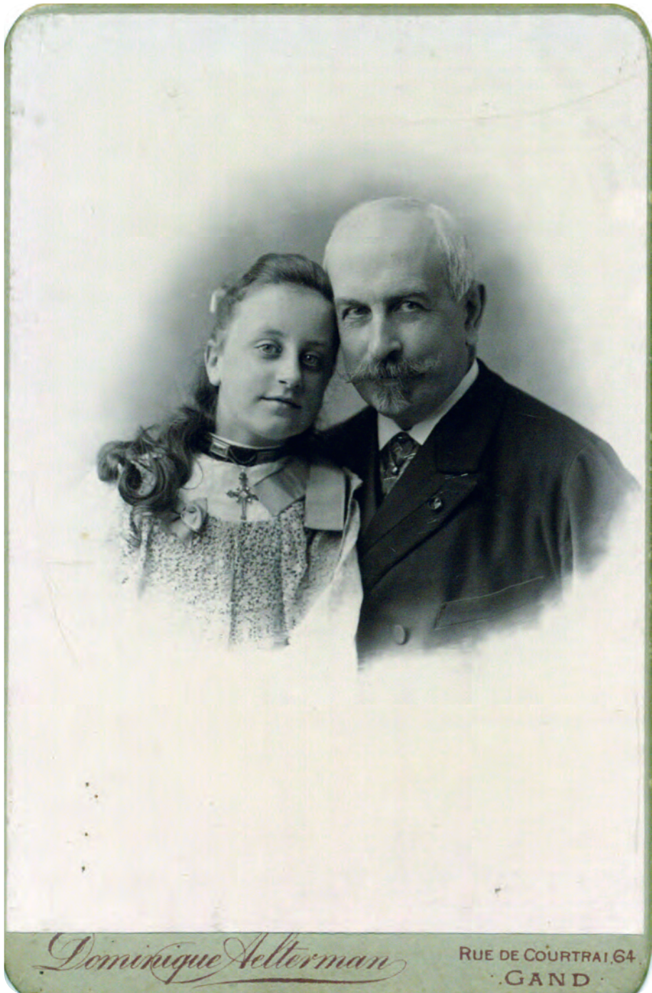
Afb. 2. Cabinetkaart met een zeldzaam intieme foto.