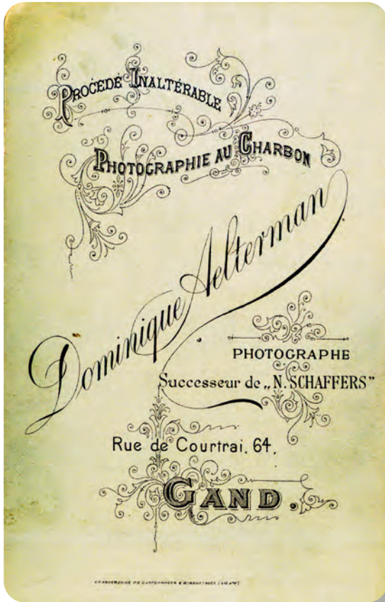
Afb. 3. Achterzijde van de kaart op afb. 2: zelfde lay-out als bij voorganger Nestor Schaffers.