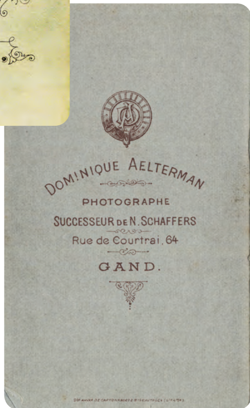
Afb. 4. Carte de visite: een veel soberder achterkant. Let op het mooie logo.