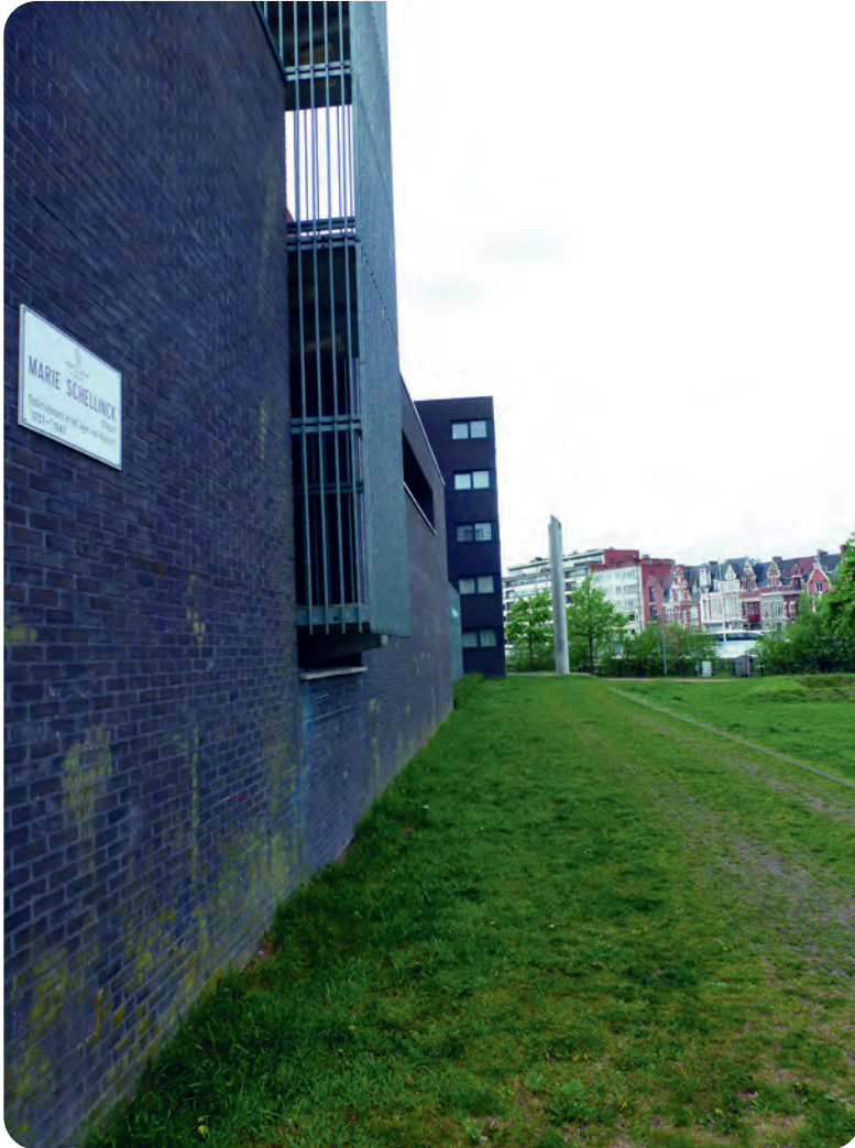
Afb. 6. Marie Schellinckstraat (foto 2019): geen echte straat. In de verte de Vlaamse Kaai aan de overkant van de (hier onzichtbare) Schelde.