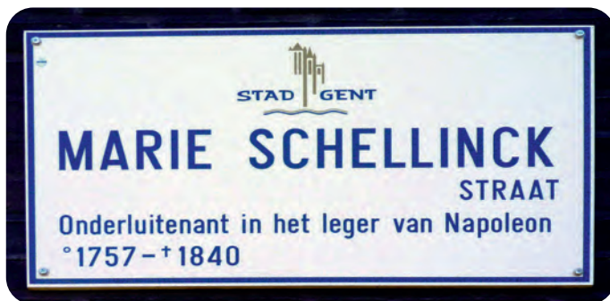
Afb. 5. Straatnaambord in de Bassijnwijk, Gentbrugge (foto 2019).

Uiteindelijk kreeg wijlen Marie Schellinck nog een heel praktische en nuttige functie. Toen het Gentse stadsbestuurders op zoek gingen naar verdienstelijke (of opvallende) vrouwen om enigszins het hopeloze overwicht van mannen in het Gentse straatnamenbestand te verhelpen, kwamen ze ook bij haar terecht. Een nieuwe straat in de urbanisatie van de Bassijnwijk op Gentbrugge kreeg