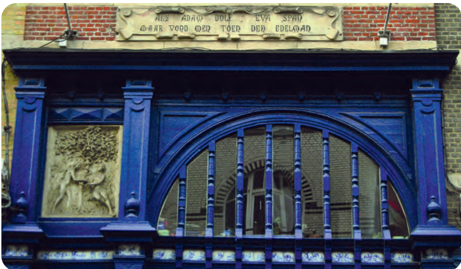
Afb. 1. Vertaling van een leuze toegeschreven aan John Ball, een van de leiders van de lollaardenopstand in Engeland in de 14de eeuw. Prachtig gerestaureerde gevelversiering van het huis Adam en Eva in de Baudelostraat (foto 2018).

Iets verder op de vest, bij de Zandpoort, was trouwens al eerder een dergelijke groep van arme broeders gevestigd (3). Zij behoorden tot het weversambacht, of sloten zich daarbij aan, en werden bogaarden genoemd, klankvariante van begaard: meer moeten we daar niet achter zoeken. In de oudste bewaard gebleven stadsrekeningen met stadscijnzen staan ze vanaf 1325-1326 trouwens vermeld als ‘begarden’. (4) Net als lollaard was die term pejoratief bedoeld.