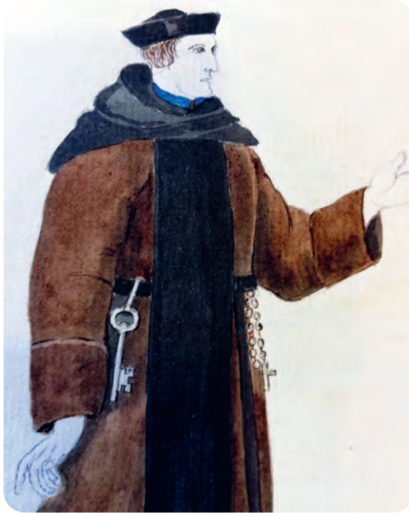
Afb. 3. Alexiaan gewapend met flink uit de kluiten gewassen celsleutel en paternoster. Een te duchten heerschap, zo te zien.