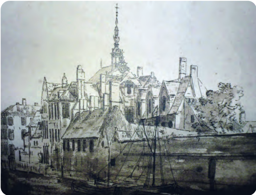
Afb. 2. Negentiende-eeuws gezicht op het Alexianenklooster en de Houtlei met boot (foto naar tekening van De Noter in Stadsarchief, Atlas Goetghebuer).

In Gent behielden de broeders hun oude stek tot in de Franse Tijd. Ze hadden er al eind vijftiende eeuw een kleine kapel gebouwd. Daar kwam in de jaren 1600 een volwaardig kloostercomplex bij (afb. 2) met de nog bestaande barokke kapel, geroemd om haar interieurdecoratie (1681). De alexianen behielden hun monopolie op begraven, dat ze stevig verdedigden. Uitzondering daarop vormden religieuze gemeenschappen die hun leden zelf mochten begraven op eigen kerkhoven. Ook enkele machtige ambachten beschikten over begraafplaatsen bij hun kapel. Zo bv. de wolwevers aan de Kortedagsteeg. (9)