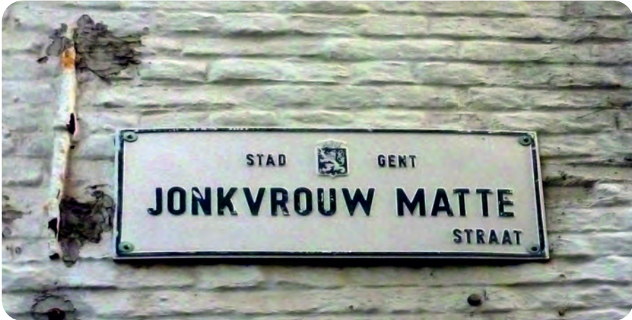
Afb. 5. Een nogal idiote vervorming van het woord op een straatnaambord: het doodarme matewif (matevrouw) getransformeerd in een adellijk klinkende jonkvrouw Matte (foto 2019).