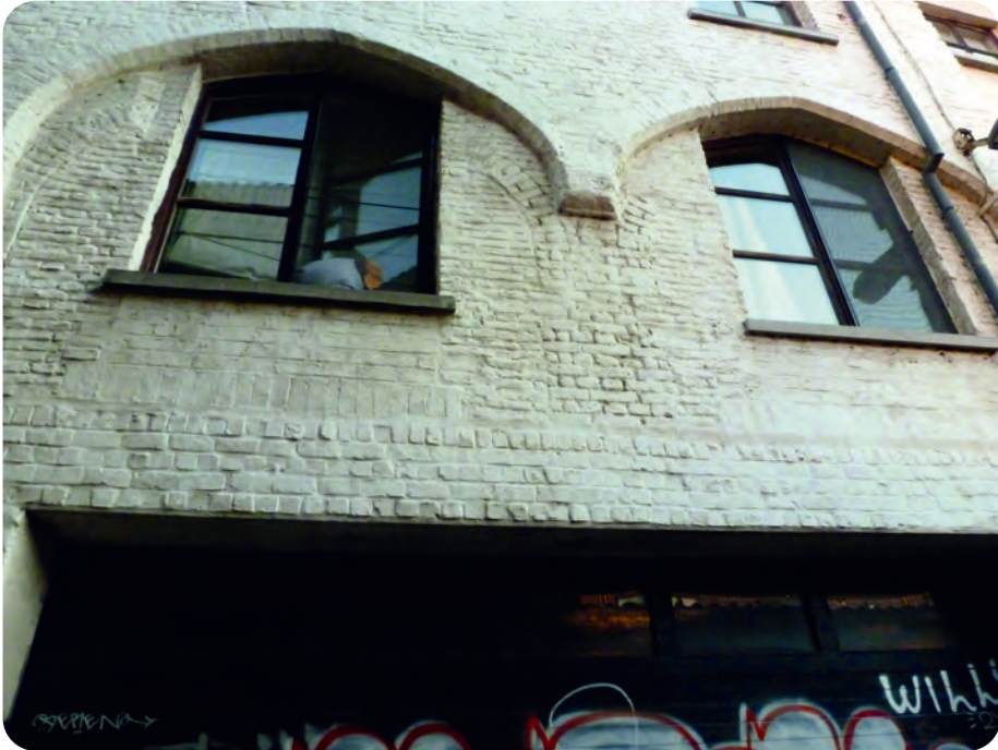
Afb. 6. Sporen van oudere toestand in de Jonkvrouw Mattestraat (foto 2019).

Engelandgat genoemd werd. Maar in 1942, toen de naam zijn huidige vorm kreeg, moest het liefst een beetje hoogstaand en duur klinken. (19)