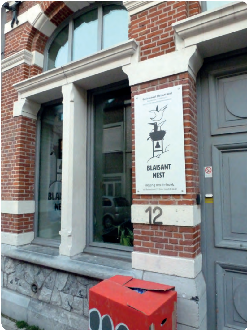
Afb. 3. Voorwaar een mooie vondst voor de schoolnaam: het Blaisant Nest (ingang in de hoofdtek van Kaprijkestraat, foto 2019).

gen...). Van tijd tot tijd was er ook wel eens een duivenjong extra, maar dat verhaal heb ik al ergens anders geschreven. Dus kreeg ik van die Canadees mijn eerste 'Engelse sieke' (kauwgom). Blijkbaar vond hij mij nog te klein om mij een sigaret aan te bieden. De voedingswaarde van die sieke zal ook wel niet fameus geweest zijn. Let op: ik heb ook nog van Duitse soldaten koekjes gekregen en opgegeten. Maar met collaboratie heeft dit niets te maken. Dus ik had al enkele ervaringen met het opzetten van die hondnogen.