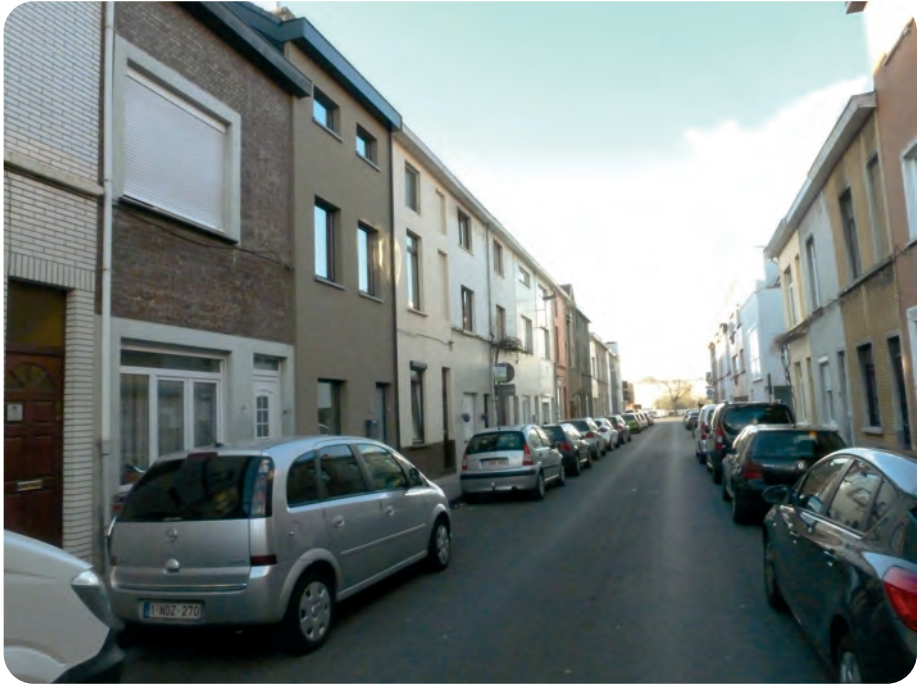
Afb. 2. De Kaprijkestraat anno 2019 (hoofdgedeelte tussen de Blaisantvest en de Gasmeterlaan). In de verte de Gasmeterlaan met de Nieuwevaart. De gevels werden ontleisterd en kregen meestal een bekleding met gevelsteentjes (plaketten) of egaal vlakke pleister. Geen spoor meer van buitenrolluiken. En uiteraard moest de koffietafel, lang geleden al, plaats ruimen voor een hele kudde heilige koeien (foto 2019).

Ik kan misschien beginnen met verder te vertellen over dat muurtje. Over de val van de Berlijnse muur werden de kranten destijds volgeschreven, met bijhorende foto's. MIJN muurtje werd in 1944 door een Canadese tank kapot gereden. Die rolde er zomaar dwars doorheen. Een handvol soldaten was immers ondergebracht in het schoolgebouw (afb. 5). Het speelplaatsje was goed voor het stationeren van enkele tanks. Van dan af ging ik, een knaapje van vier jaar oud, dagelijks aan het kapotgereden muurtje staan.