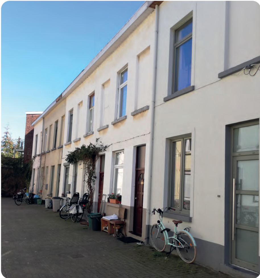
Afb. 6. De zijsteeg van de Kaprijkestraat, de cité waar de auteur opgroeide, is nu heel wat gezelliger: een woonerf. De voetpaden zijn verdwenen: voetgangers en spelende kinderen hebben het straatje terug ingepalmd. Achterin de heropgebouwde muur. Een steeds open poortje geeft toegang tot de hof van het vroegere Maria Gorettikerkje en even verder tot de Blaisantvest. Het is dus nog steeds een cité, maar wel van het betere type (foto 2019).

pogingen om de Duitsers te doen betalen hadden geen resultaat. Juulken kende nochtans een Duitser die tijdens de oorlog bij Der Völkischer Beobachter als journalist had gewerkt, en nu zijn taak verderzette bij Buitenlandse Zaken. De brieven kwamen echter ongeopend terug. Ja, op de omslag stonden, meestal met rood potlood, enkele schrijffouten aangestipt, want zijn Duits was niet zo perfect. Hoe durven ze, alsof hun Vlaams tijdens de bezetting altijd zo correct was. En dat hij zijn verzoekschrift met de woorden Sieg Heil had afge-