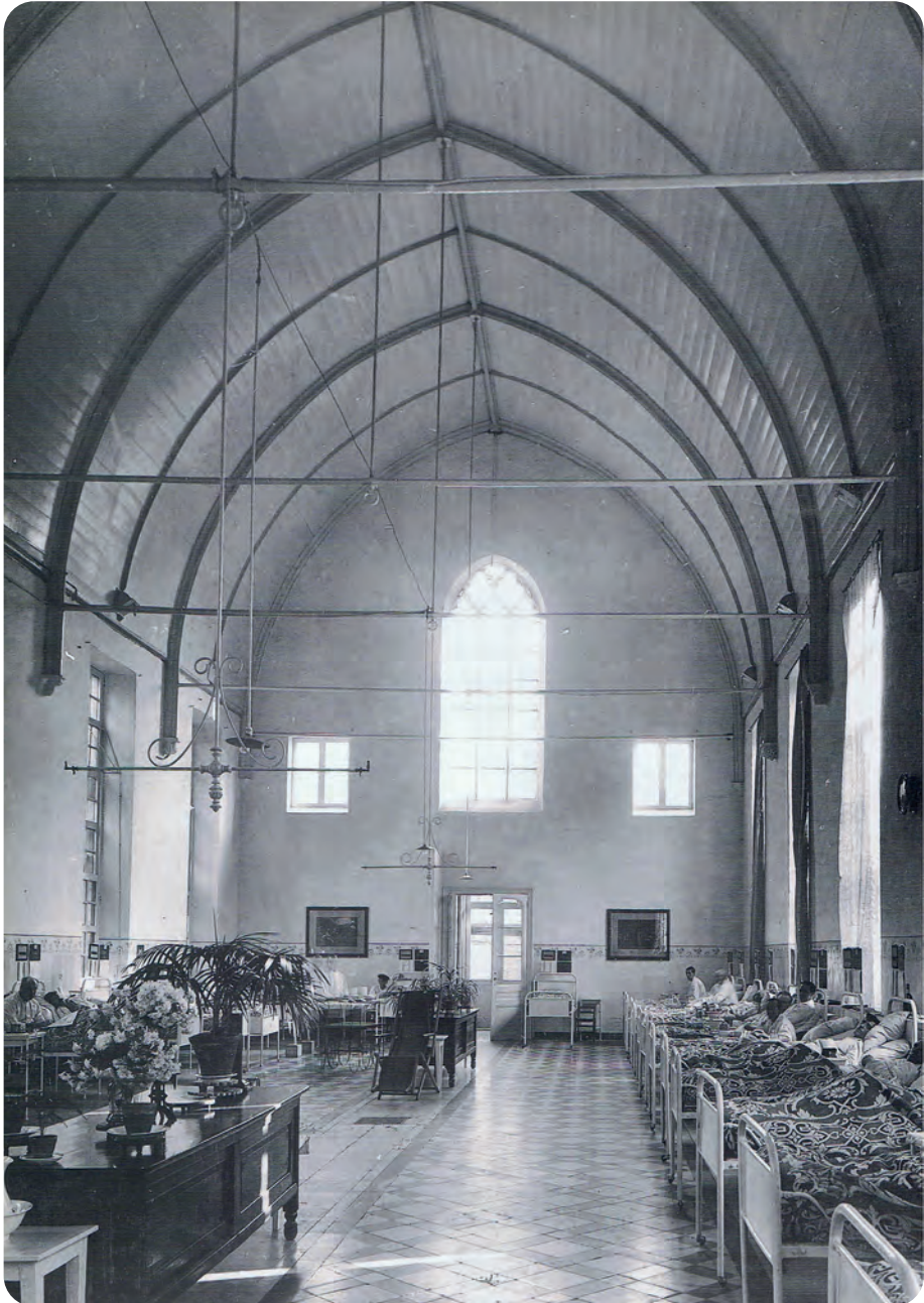
Afb. 4. Het Kraakhuis als ziekenzaal in de vorige eeuw.