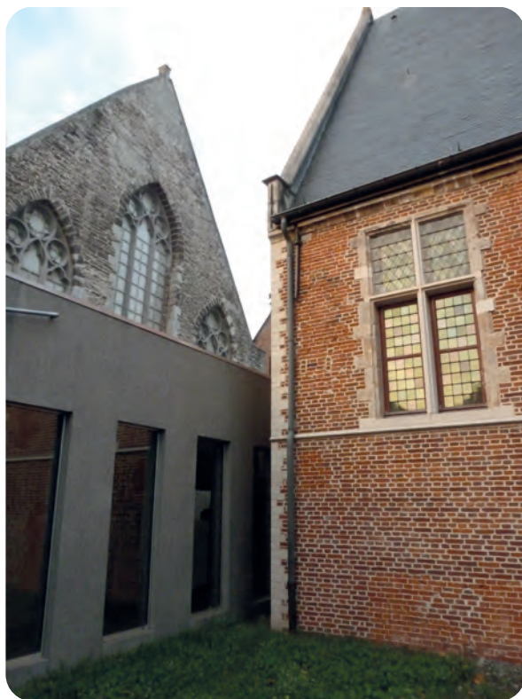
Afb. 1. Links de achtergevel van de middeleeuwse grote zaal in grijze Doornikse steen. Rechts, scherp contrasterend daarmee vanwege de bakstenen constructie, een deel van het zestiende-eeuwse Kraakhuis (foto 2018). Tussen beide (onderaan) een recente overdekte verbindende toegang. Uitwendig is het Kraakhuis moeilijk vindbaar op de Bijlokesite en voor buitenstaanders slechts gedeeltelijk zichtbaar.

Het bij de liefhebbers van kamermuziek welbekende Kraakhuis van de Bijloke, de kleine concertzaal achter de majestueuze middeleeuwse grote zaal annex kapel, heeft vanouds een intrigerende naam. In dit kort artikelje zullen we zien dat dit niet het eerste en ook niet het enige Kraakhuis was in Gent. Telkens duikt de naam op in verband met de opvang van lijdens aan builenpest. We komen tot de conclusie dat Kraakhuis zeer waarschijnlijk de volkse benaming was voor Pesthuis.