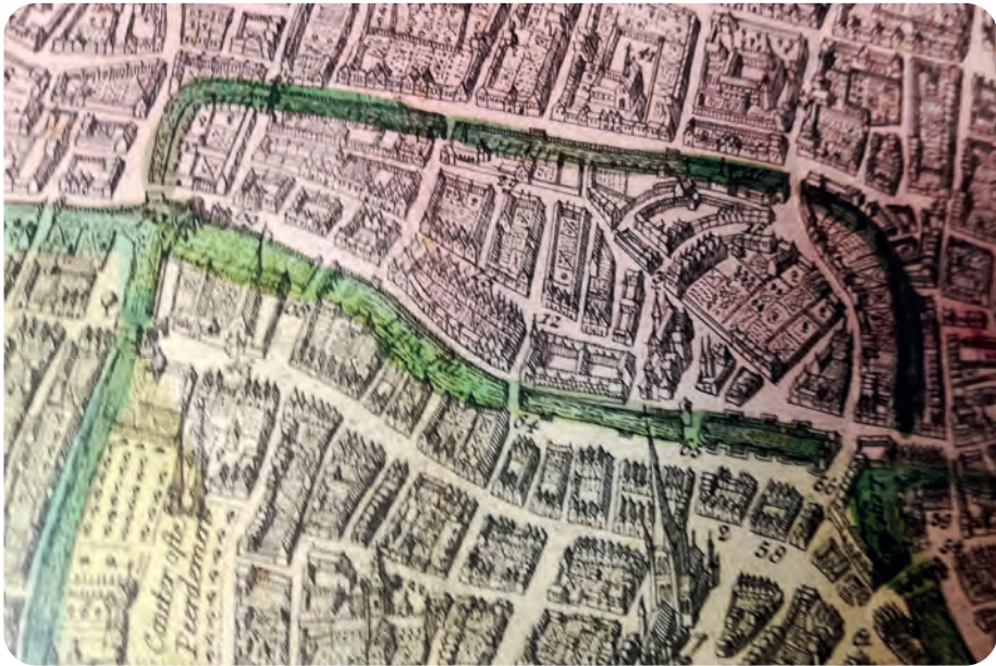
Afb. 1. Gedeelte van de twaalfde-eeuwse stadsvest. Links onder beginnend, zien we naast de Ketelvaart de beboomde Kouter met twee ‘gaaisprangen’ (schutterstorens). De vestwal (Koutervest) naast het kanaal, waarop oorspronkelijk ook ‘gariten’ aangebracht waren, is weggegraven. Naast het minderbroederklooster (nu Oud Justitiepaleis) ‘dwarst’ dit kanaal de Leie ter hoogte van de huidige Pekelharing. Even verder maakt het kanaal een bijna rechte hoek en vervolgt nagenoeg parallel met Leie als Houtlei om tenslotte terug om te buigen naar de Leie. De begraafbroeders huisden op de vest in ‘gariten’ bij de Turrepoort, nu Poel, boven rechts (detail uit een bewerkte versie van het stadsplan van Hondius, 1641).

Het hierboven beschrevene is een veronderstelling: van het aarden wallichaam bleef niets over voor archeologisch onderzoek. Nadat de verdedigingsfunctie in de jaren 1300 verdween, kon de zandige aarde immers gebruikt worden voor allerlei ophogingen en bouwwerken. Bij de muur lag dat anders: die bleef bewaard waar hij een functie kreeg als achterwand van er tegenaan gebouwde huizen, zoals bij de Zandpoort het geval was, en ook (maar dan half – of meer dan half – afgebroken) als veststraatje: het Schokkebroersvestje. ‘Bewaard’ is bij dat ‘vestje’ wel niet het juiste woord. In de vorige eeuw immers verdween wat er nog van overgebleven was na de gedeeltelijke afbraak omstreeks 1560. Er resten enkel een paar foto’s en andere afbeeldingen (zie afb. 2 hierbij en in de vorige GT aflevering: afb. 1 en 2).