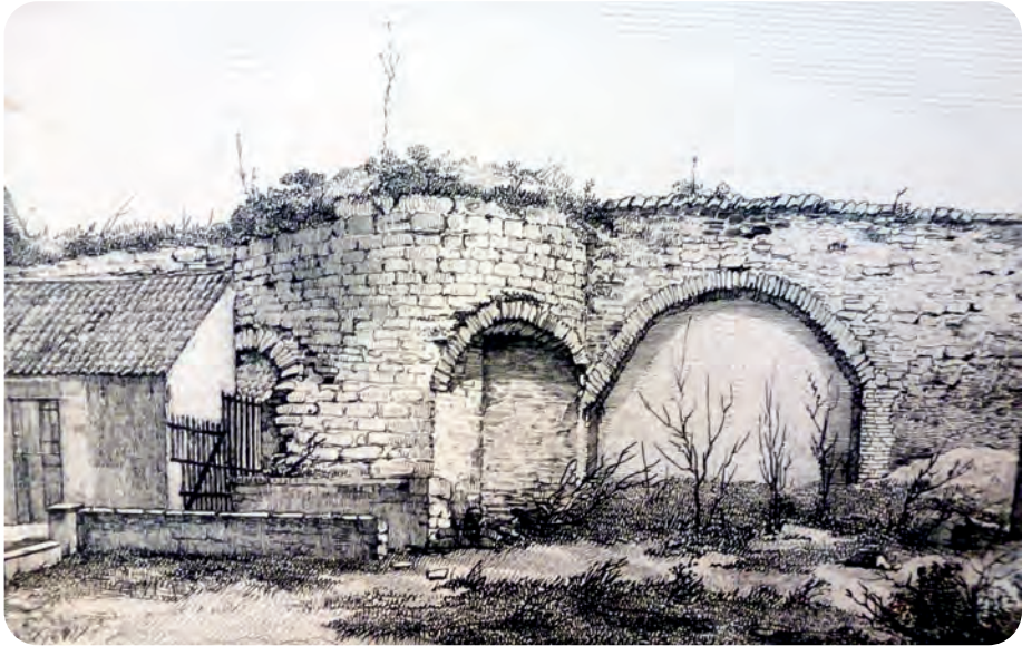
Afb. 2. Ruïnes van de vest aan de Houtlei met duidelijk herkenbaar de basis van een toren en een spaarboog (uit Messenger des Sciences historiques de Belgique , Hebbelynck, Gent, 1843).