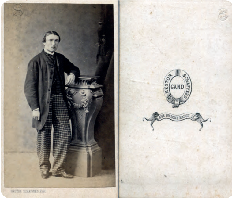
Afb. 4 en 5. Carte de visite. Een sober interieur met effen achtergrond en een kolom, een stoel, soms een zetel. Nog altijd met de initialen in reliëf.