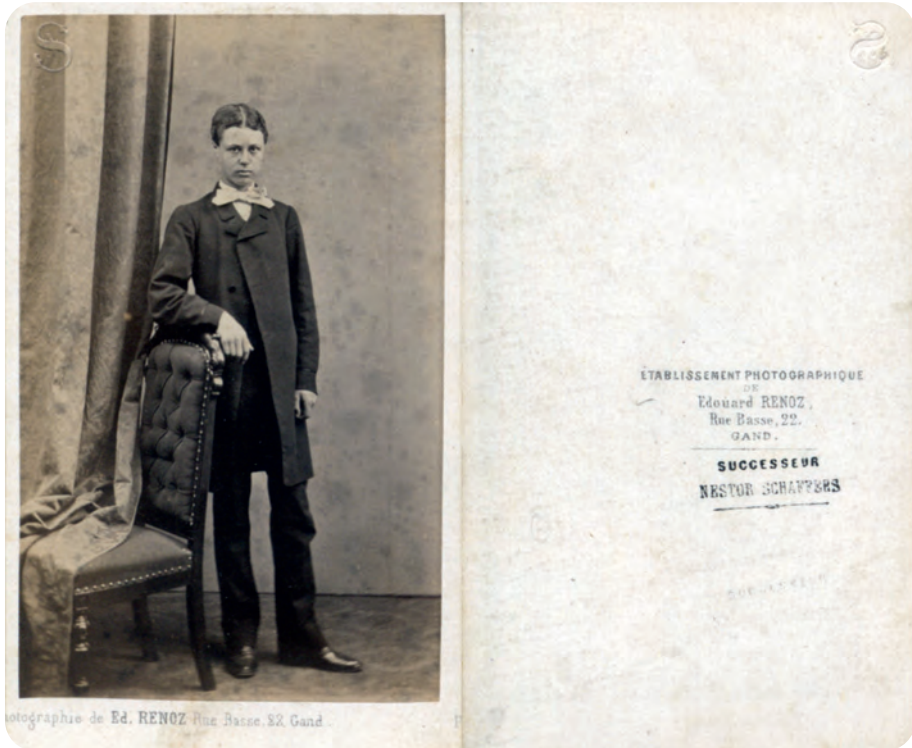
Afb. 1. Carte de visite. De periode dat Schaffers werkzaam was in de Onderstraat 22 te Gent. Sober interieur, eigen aan de foto's uit die tijd.