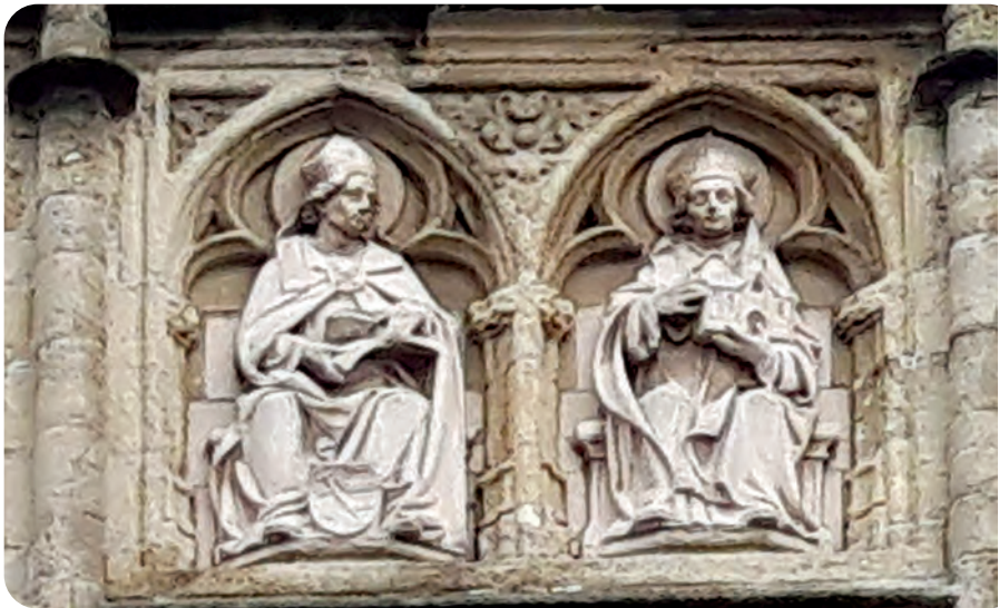
Afb. 9. Sint-Arnold, patroon van de brouwers, en Sint-Amand (foto 2019) naast het brouwersblaozen aan de zijde naar de Grasbrug toe. De eerste zit in een boek te bladeren en heeft een miniversie van het brouwerskenteken (zie afb. 8) met strepen en moeilijk herkenbare brouwersattributen aan de voeten. Sint-Amand is duidelijker: hij paradeert met een model van een abdijkerk op zijn ene arm.