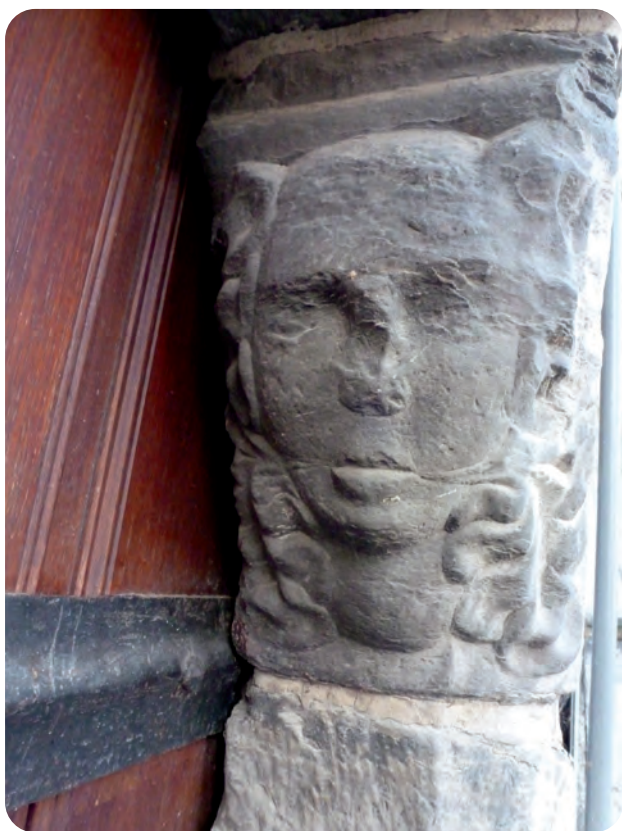
Afb.7. Geen engelenhoofden, maar ‘bladerenhoofden’(bladmaskers) in de sluitstenen aan weerszijden boven de ingang deur van de half ondergrondse verdieping, zeer waarschijnlijk oorspronkelijk gelijkvloers van het middeleeuwse Steen De Ingel. Dit is een vriendelijk ogende variante van de ‘groene man’ of ‘wildeman’ (Engels: green man). De meest waarschijnlijk betekenis is hier die van beschutter, behoeder van de ingang.

Een tijdlang functioneerde het gebouw als ambachtshuis van de niet erg honkvaste Gentse brouwers. Dat werd weergegeven in de gevelversiering met hun blazoen (afb. 8) met daarbij ook nog een beeld van hun patroon Sint Arnold.