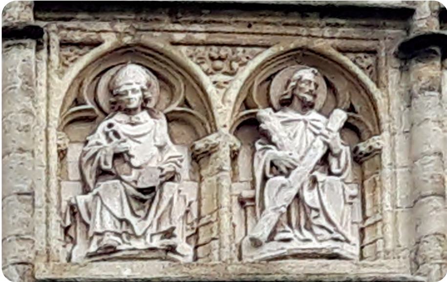
Afb. 10. De twee heiligen naast het wapenschild aan de zijde naar de Sint-Michielsbrug toe. Links het beeld van Sint-Lieven met als attribuut de tang waarmee booswichten zijn tong uitrukten. Rechts de enige heilige die met het blote oog vanop de grond goed herkenbaar is: Sint-Andries met het X-vormige kruis waarop hij de marteldood stierf. Wat die hier komt doen, is ons een raadsel.