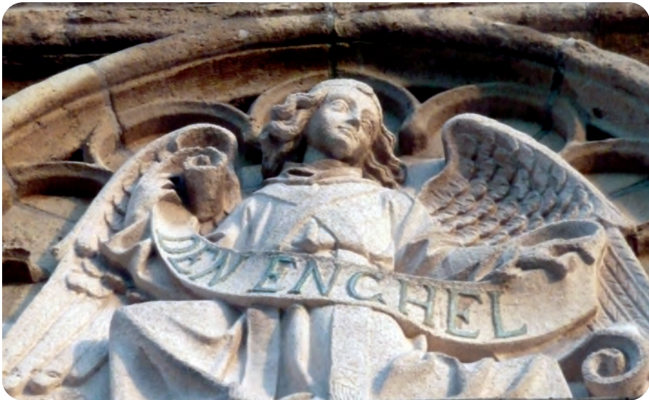
Afb. 6. Zwierige neogotische engel in het centraal paneel van de bovenverdieping aan de Graslei, refererend naar een vermoedelijk foutieve interpretatie van de huisnaam. De geknielde figuur toont op een banderol de huisnaam Den Enghel. Een tweede mogelijke betekenis, die van hengsel, ‘hingel’ of hijsbalk is hier meer op zijn plaats.

Enkel als men zou vasthouden aan de naam Metselaarshuis, is het nep. Die on-eigenlijke naam aan de Graslei is absurd, op het ridicule af. Overigens was ook de oudere gevel aan de Cataloniëstraat letterlijk ‘façade’, maar dan wel 16de-eeuws. Net als de 20ste-eeuwse van de Ingel aan de Graslei, werd hij immers tegenaan een veel ouder middeleeuws Steen gebouwd. Vooral door overvloedig gebruik van kalksteen uit het Doornikse, gemakkelijk via de Schelde aangevoerd, gaat de ‘stenen’ geschiedenis van het Gentse centrum ver terug in de tijd, en dat maakt het er niet eenvoudiger op.