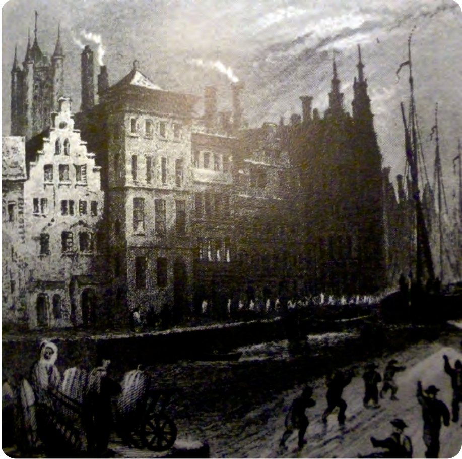
Afb. 5. De Ingel in de 19de eeuw met de obligate horizontale kroonlijst (reproductie in de schenking Kluyskens in DSMG, onbekende herkomst en jaartal). De voorbouw rijkt tot boven het dak van het achterliggende hoofdvolume en was bedoeld om te imponeren. zoals ook nu nog te zien is aan de Nederpolder - Biezekapelstraat.

aanzienlijke hoogte doorlopend, vanaf de kelder- (of gelijkgrondse) verdieping tot helemaal bovenaan uitlopend in fiolen (pinakels), die een heel eind boven de eigenlijke geveltop uitsteken. Voor die pinakels en de gevelindeling kon de architect zich inspireren op de realisatie in 1526 van Christoffel van den Berghe bij de Sint-Niklaaskerk, maar door de hoogte-breedte verhoudingen oogt het toch helemaal anders.