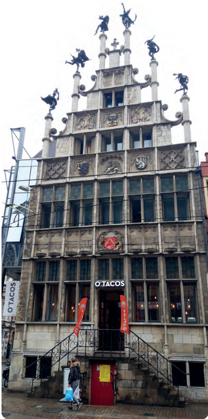
Afb. 2. De eind vorige eeuw gerestaureerde-gereconstrueerde 16de-eeuwse gevel aan de Cataloniëstraat van het originele Metselaarshuis.