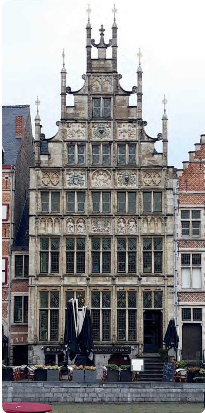
Afb. 3. De hier beschreven gevel aan de Graslei, in 1912 geplaatst tegenaan het veel oudere authentieke Steen Den Ingel uit (vermoedelijk) de tweede helft van de 13de eeuw (foto 2019 TDM). Zoek de verschillen ... en geef dit gebouw de naam die er bij hoort: De Engel.