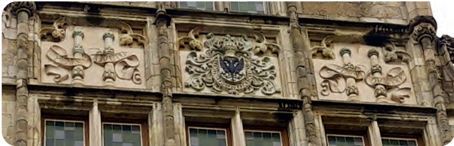
Afb. 11. De opdrachtgevers konden niet genoeg krijgen van keizer Karel en de Habsburgers. Ook aan de Graslei twee keer het Spaanse element met zogenaamde Herculeszuilen, telkens twee stuks, en daarbij nog twee keer Plus Oultre (zie artikel over het Metselaarshuis). De Maagd van Gent moest hier, lichtjes anachronistisch, plaats maken voor de keizerlijke en koninklijke dubbele arend, symbool van de Oostenrijks-Hongaarse dubbelmonarchie.