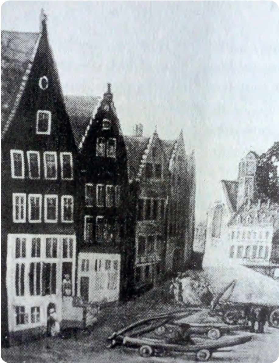
Afb. 1. Huis De Ingel, detail van een achttiende-eeuwse voorstelling van de havenactiviteit aan de Leie. Uiterst links het bewuste huis: het hoogste gebouw aan de Graslei. Op de voorgrond platte smalle wagens voor vervoer van o.a. biertonnen (reproductie in DSMG, Begijnhof, Sint-Amansberg).