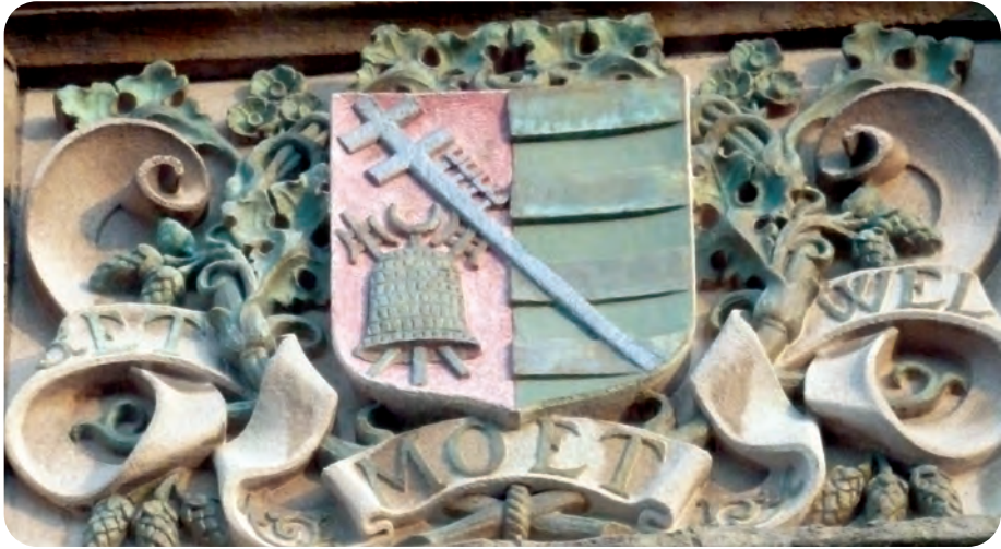
Afb. 8. Gereconstrueerd wapenschild van de brouwersnering met spreuk 'Het moet wel' (refererend naar mouten), horizontale banden en links daarvan moutkorf met 'rake' . Blaozen en spreuk zijn versierd met hopperanken en –'bellen'