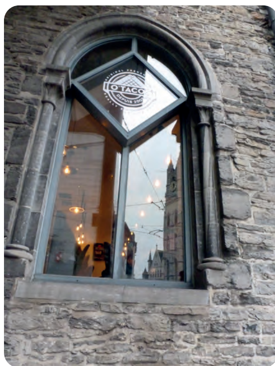
Afb. 6. Gereconstrueerd venster in de Sint-Niklaasstraat met zijkolommetjes en hedendaagse invulling als getuige van het middeleeuwse Steen De Rode Deur. Bemerkt de grijze (Doornikse) kalksteen (foto 2019).