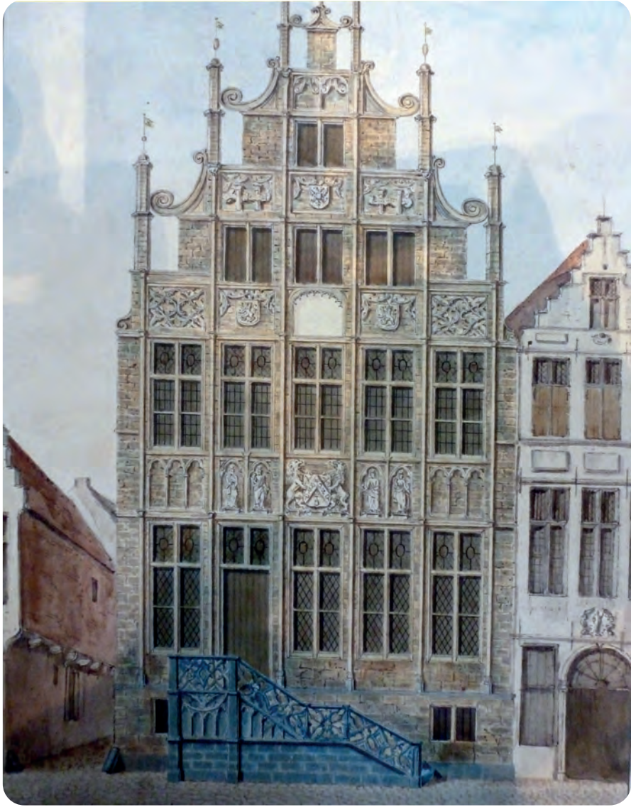
Afb. 7. De voorgevel zoals architect P.J. Goetgebuer die in 1836 weergaf, mede op basis van wat hij zelf zag en van een aquarel van J.B. De Noter (1809), met eigen interpretaties. Voor wat betreft de pinakels en het wapenschild van de nering volgde hij vermoedelijk hun bepalingen in het contract uit 1526. De dansers ontbreken, maar hij voegde er wel patroonheiligen aan toe, die enkel in veel latere documenten vermeld worden. De hoofdingang, met hier nog enkele trap, zit niet op de oorspronkelijke centrale plaats. De ondersteunende 'krullen' tussen de pinakels en het maaswerk aan de trapleuning zijn ook eigen toevoegsels (Archief Gent, Atlas Goetgebuer L85/23a). Bij Daem (1990) en Van den Bossche (1992) worden nog andere, latere 19de-eeuwse afbeeldingen met elkaar vergeleken. Die blijken allen afgeleid van Goetgebuer. Let ook op de nauwe Kromsteeg links. Vergelijk deze tekening met de huidige toestand (foto in het GT artikel over het huis De Ingel aan de Graslei).