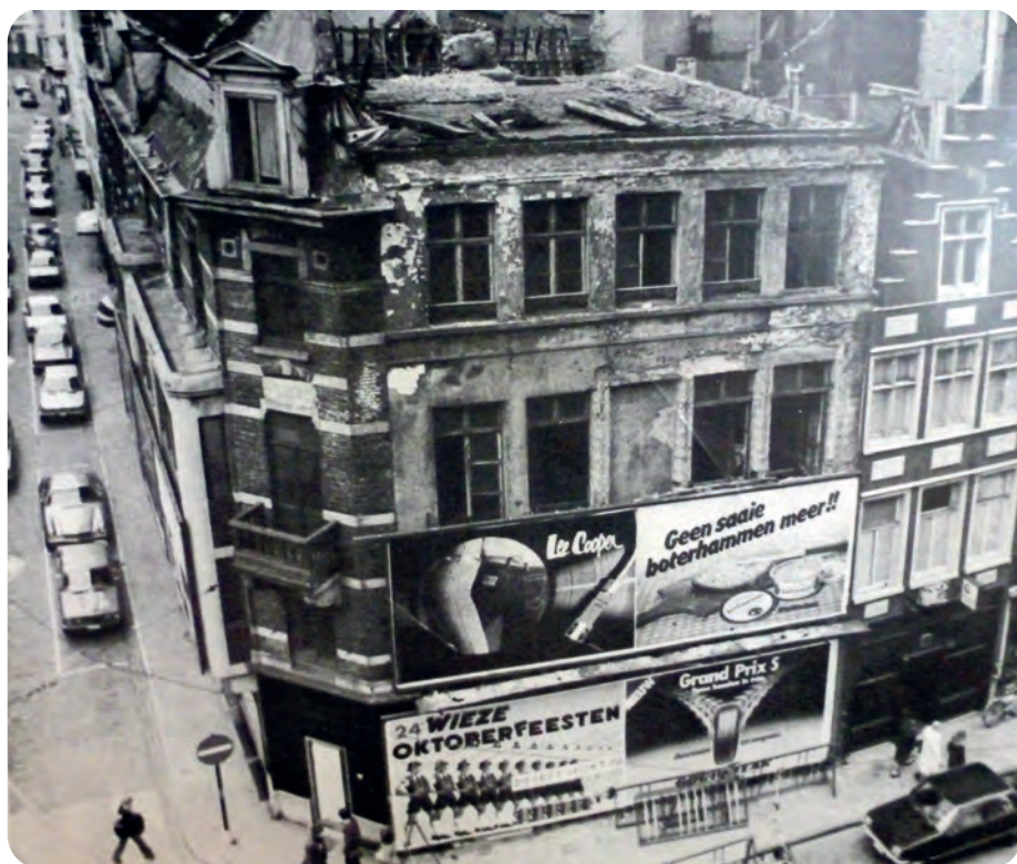
Afb. 1. Het verloederde Metselaarshuis aan de Cataloniëstraat in 1978. Vergelijk met afb. 2 en let op de bijgevoegde 'schil' aan de hoek. Die moest dienen om de Kromsteeg te helpen omvormen tot de huidige Sint-Niklaasstraat met kaarsrechte rooilijnen naar 19de-eeuwse mode (uit: Cultureel Jaarboek Oost-Vlaanderen, 1978).