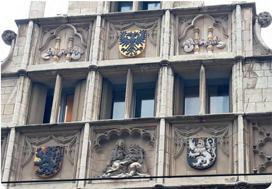
Afb. 8. De Maagd van Gent, centraal onderaan, geflankeerd door de blazoen van het graafschap Vlaanderen (links) en de stad Gent (rechts) en gedomineerd (symbolisch?) door de symbolen van keizer Karel: centraal de dubbele keizerlijke en koninklijke adelaar, die hier eigenlijk niet thuishoort, en twee keer de Spaanse symbolen: de ‘Zuilen van Hercules’ en de wapenspreuk Plus Oultre. Voor de betekenis: zie tekst.

sieringen beschreven staan (met onder meer de Moreske dansers), kwam aan het licht. Marcel Daem publiceerde er een zeer degelijke studie over in GT (1990), die heel wat meer informatie bevat dan de titel laat uitschijnen. Samen met de, op de geveltop na, vrij goed bewaarde buitenmuurresten, vormden de ‘papieren’ gegevens een stevig stramien om een historisch verantwoorde restauratie-reconstructie te plannen en uit te voeren.