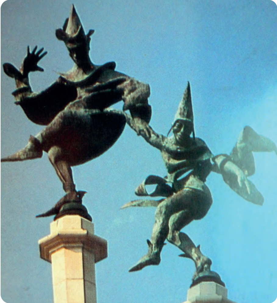
Afb. 10. Twee dansers op hun hoge werkplek (ongedateerde foto van onbekende herkomst in DSMG). De beelden worden verondersteld te draaien met de wind, iets wat misschien niet altijd vlotjes verloopt. In 1996 al moest de brandweer de beelden naar beneden halen om er beter draaiende voetstukken met kogellagers te laten onder monteren.

Het gebouw werd gedeeltelijk eigendom van de provincie, die er in de eerste jaren een informatiewinkel voor toerisme in Oost-Vlaanderen in onder bracht. In de Sint-Niklaasstraat werd tegen de slechts fragmentair behouden originele gevel van het Steen een constructie in beton en spiegelglas geplaatst. Het vloekt niet, maar echt passen doet het al evenmin. Veel Gentenaars zijn er niet