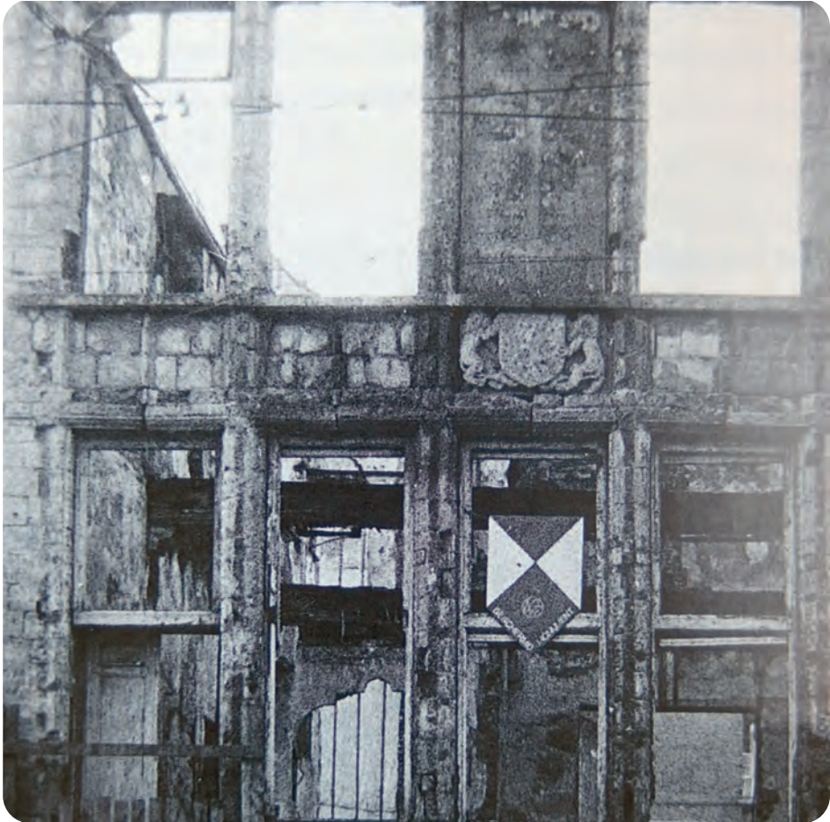
Afb. 4. De in 1976 ontdekte gevelsteen met het (afgekapte) blazoen van de metselaarsnering centraal boven de oorspronkelijke ingangsdeur van het neringhuis (uit Van Doorne, 1992). Dit vormde de aanzet tot acties die leidden tot de bescherming en restauratie. Er onder het insigne BESCHERMD MONUMENT: wellicht niet toevallig veel groter dan normaal...

onderaan nog gedeeltelijk behouden muur van het oude Steen maximaal vrij gemaakt en gerestaureerd worden (afb. 5 en 6). Dat visueel vrijmaken gebeurde middels een soort galerij onder een grotendeels glazen constructie boven het verbrede voetpad.