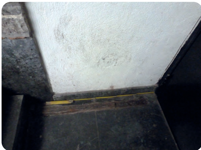
Afb. 5. Een afgesloten toegang tot de kelders aan de Sint-Niklaasstraat reveleert de formidabele dikte van de muren van zo'n middeleeuws Gents Steen: hier aan de straatkant gemiddeld 1,3m op het huidige voetpadniveau (foto 2019).