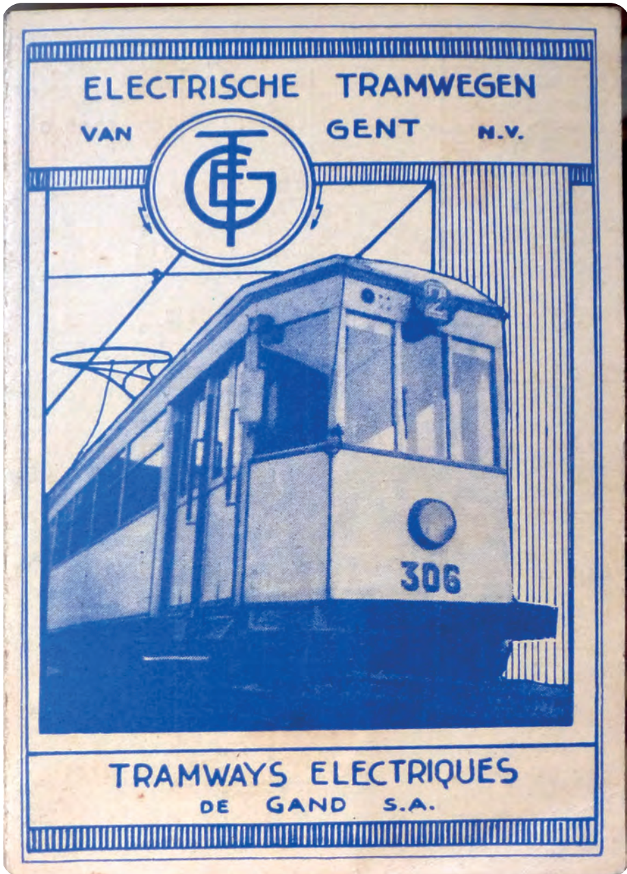
Afb. 2. Illustratie op de voorzijde van de tabel op Afb. 3 met tweetalige naam van de tram- maatschappij.