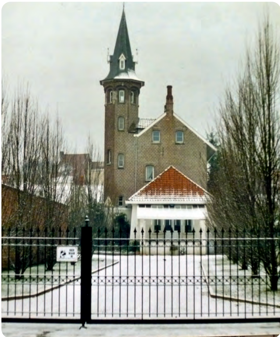
Afb. 2. Het kasteeltje aan de Nekkersputstraat. Een winterse foto in 2001 genomen door Luc De Paepe.

dresseurs, een slangenmens, pony's, grond- en wiplank-acrobaten, Indische olifanten, Bengaalse tijgers, leeuwen en, als de belangrijkste attractie: dansende paarden. De verzameling van André De Poorter met o.a. affiches van Circus Demuynck wordt momenteel bewaard in het Huis Van Alijn.