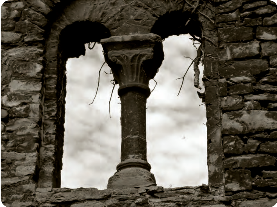
Afb. 2. Romaans venster met middenzuiltje in de oostelijke wand van dezelfde zaal (foto 2018).

Naast hun uiteenlopende kwaliteiten, hadden alle vulsels typische ongemakken en nadelen. Veerpluis en -stof waren aantrekkelijk voor insecten, die in de zomer gemakkelijk via de ramen binnenkwamen. In de abdij konden de ramen van het dormitorium enkel door houten luiken worden afgesloten. Paardenhaar en wol begonnen nogal eens te stinken, wat dan bestreden werd met geurende kruiden. Wol kwam gemakkelijk onder de mot te zitten. Het koken ervan was een lastige en omslachtige oplossing. Het dons werd van ganzen en eenden geplukt, en was duur. Vooral dat van de eidereend was gegeerd. De wetenschappelijke soortnaam mollissima duidt erop: die betekent zoveel als allerzachtst.