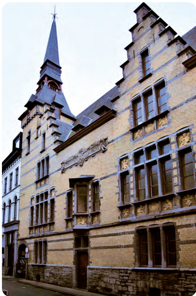
Afb. 3. Het Laurentinstituut, een schoolgebouw waarin de architect zich - zo te zien - kon uitleven. Een vleugel in eclectische stijl uit 1903, met (waarachtig!) een torentje, tegen een iets beter behouden rechtere vleugel met hoofdingang voor de school.