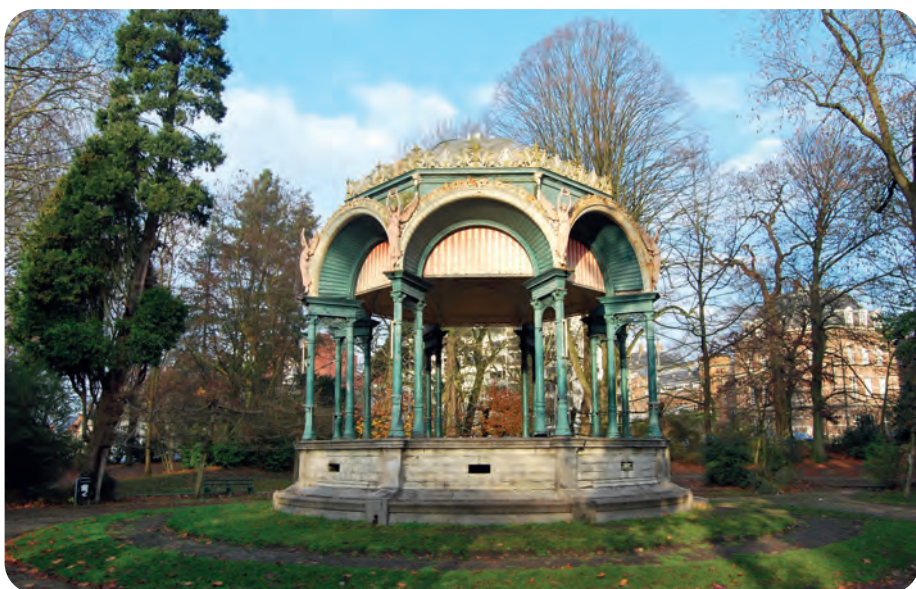
Afb. 7. Actuele toestand. Het nog steeds fraaie gebouwtje is enkele van zijn sierpluimen kwijtgespeeld (foto TDM, 2018).