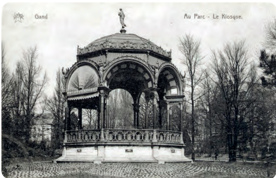
Afb. 6. Kiosk in het Citadelpark naar een ontwerp van Charles Van Rysselberghe gebouwd in 1885. Nog in volle glorie op deze ongedateerde postkaart.