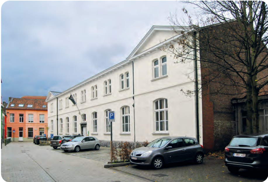
Afb. 2. Vroegere stadsschool aan Klein Raamhof uit 1900, later museum 'De School van Toen'. Gebouwd in 1901 in neoclassicistische stijl met tempelachtige frontonnetjes (foto 2018, TDM). Een type dat toen 'in' was bij de stadsscholen, die zich o.m. daarin wensten te onderscheiden van neogotische katholieke schoolgebouwen. Charles Rysselberghe ontwierp een hele reeks scholen van dat standaardtype. Van de 22 Gentse stadsscholen die we van hem kennen, bleef de sfeer hier het best bewaard, schrijft Dirk Laporte e.m. in Gids voor architectuur in Gent (2003, Lannoo, Tielt).

dens de Tweede Wereldoorlog werden verwoest, was het ook onontbeerlijk om de oorlogsschadedossiers voor deze huizen te bestuderen. Deze dossiers, bewaard in het Rijksarchief, gaven ons een goed zicht op de omvang van de schade, maar slechts een geringe kijk op de eigenlijke structuur van de gebouwen, omdat bepaalde iconografische stukken uit de dossiers zijn verdwenen. In hetzelfde archiefdepot bevinden zich ook de nalatenschappen van de architect en zijn echtgenotes. In combinatie met verschillende notariële akten over de aan- en verkoop van de gronden en huizen gaven deze bronnen een goed zicht op de financiële component in ons verhaal. Gezien de architect pas in 1920 overleed, hebben we deze bronnen moeten bestuderen via de afschriften die in de hypotheekkantoren werden neergelegd. Bij notariële akten zijn immers enkel de documenten ouder dan 100 jaar voor het publiek toegankelijk, bij de afschriften van de hypotheekkantoren is dat niet het geval, ook al gaat het om dezelfde inhoud.