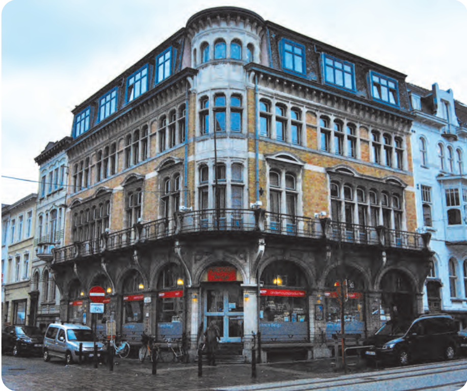
Afb. 5. Aan de hoek van de Kammer- en Belfortstraat: in eclectische stijl gebouwd in opdracht van de Stedelijke Gas-, Water- en Elektriciteitsdienst, begin twintigste eeuw. Huidige functie: woon-winkelcomplex.

dwars door het oude stadswefsel getrokken in 1899 (afb. 5).