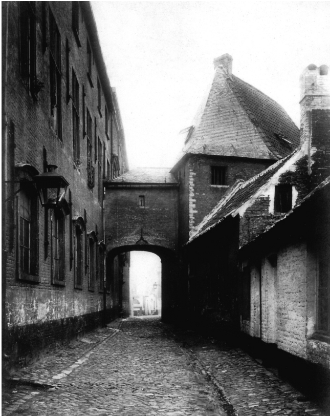
Louis Mast zag het levenslicht in één van die schamele huisjes rechts in de Schokkebroedersvest dat gesloopt werd in 1903. Links de kapel van de Alexianen. Hier kijken we in de richting van de Poel.

Hij schreef in het Nationaal Biografisch Woordenboek (2) een beknopte levensbeschrijving over deze kunstenaar maar moedigde mij aan bij gelegenheid een bijdrage met mijn resultaten te plaatsen in ons gerenommeerd tijdschrift Ghendtsche Tydinghen.