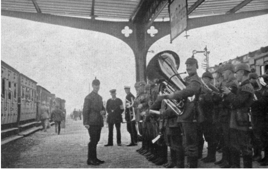
Duitse bezetting 1916.