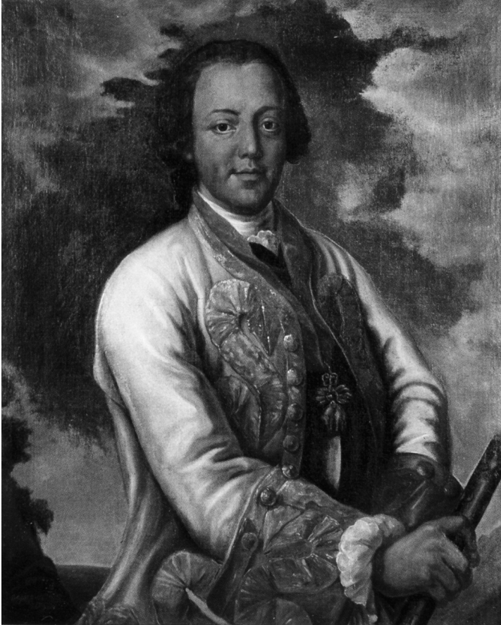
Karel Van Lotharingen 1712-1780.

Karel van Lotharingen. Karel was de schoonbroer van Maria-Theresia want hij was getrouwd met haar zuster Anna. We mogen zelfs zeggen de dubbele schoonbroer, want zij was getrouwd met de broer van Karel, François de Lorraine.