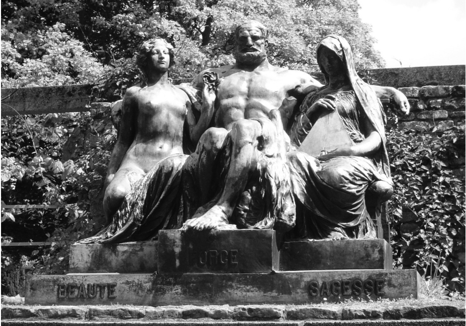
Beauté, Force, Sagesse.