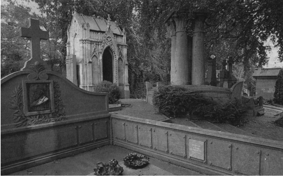
Neogotische grafmonumenten op het Campo Santo.

stige herinneringen dezer plaats, eene soort campo santo zijn voor bemiddelde lieden, voor adellijke families, voor personen door deugden en hoedanigheden aanzienlijk.”