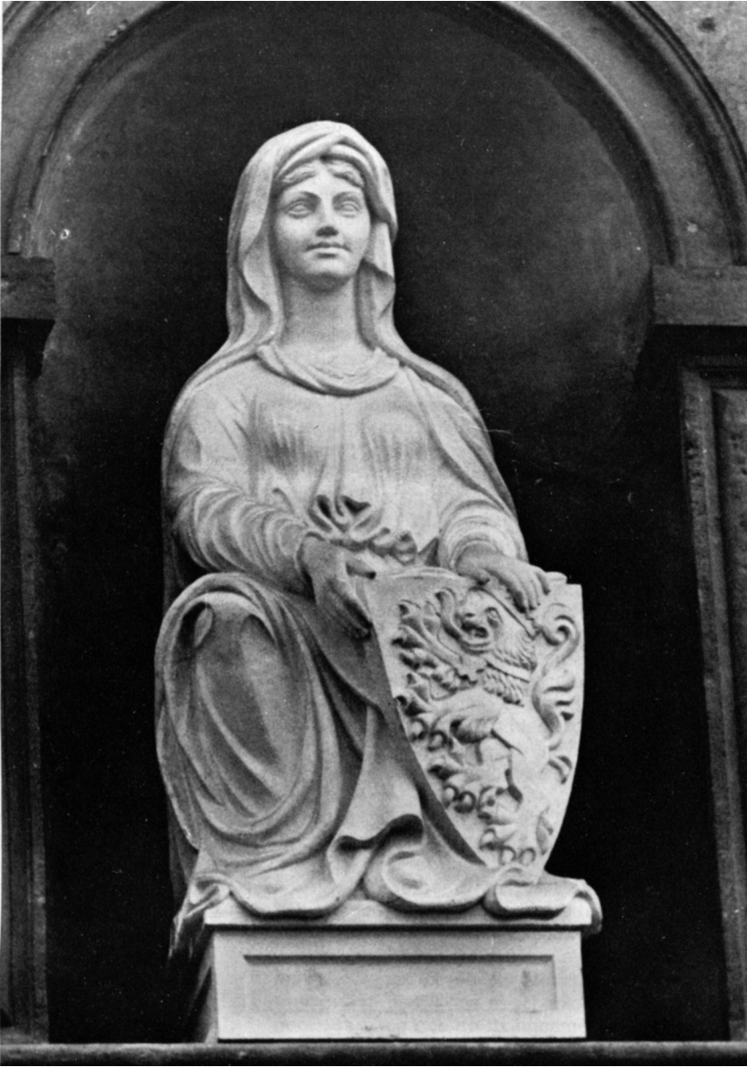
Het nieuwe beeld van de maagd van Gent aan het Emiel Brauninstituut in de Voldersstraat, van beeldhouwer Achiel Andries.

Zie "Ghendtsche Tydinghen" - 2011 - N° 1 - p. 88