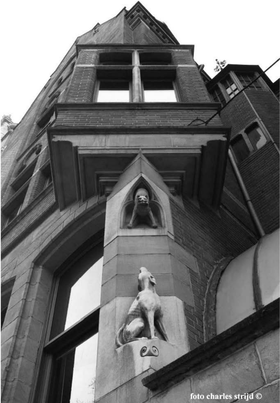
Leopold II laan: De Kat en de Hond