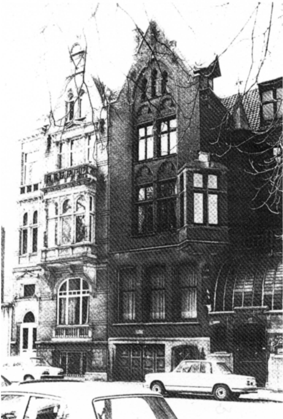
Leopold II laan: De Kat en de Hond