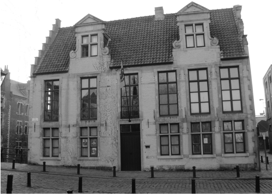
Afb. 6. Lievekaai: woonhuis van de familie Burger van 1865 tot 1876. Huidig uitzicht (februari 2011).

Na nog diverse andere locaties te hebben aangedaan verblijven ze definitief vanaf 30 augustus 1882 in de Brabantdam waar ze verder in de wijn- en likeurhandel en -stokerij bedrijvig blijven. ( 3 ) Het bedrijf van de familie