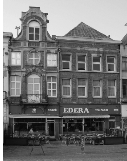
Afb. 4. en 5. Vrijdagmarkt: gevel van 'Au cheval d'or' in 1897 en huidige situatie (februari 2011).