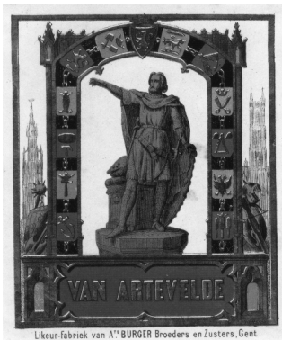
Afb. 1. Likeuretiket - vermoedelijk ontworpen in 1863 door Judocus Joseph Lobel. Verzameling R. De Vriendt-Mores.

Steendrukker Judocus Joseph Lobel (1824-1895) die toen in de Walpoort(brug)straat woonde, ontwierp deze chromolitho waarbij gebruik werd gemaakt van verscheidene kleuren. Zijn naam is – moeilijk leesbaar - in de linkeronderhoek van de buitenste omlijsting aangebracht. Het Artevelde-beeld is uitgevoerd in groen/grijs/zwarte tinten op een crèmig – witte achtergrond, het beeld is omkransd door een fries met 12 nering-emblemen in een groen/ blauwe en karmijnrode combinatie met gouden omlijsting. Onder de afbeelding van het standbeeld is de naam Van Artevelde gedrukt in gouden letters op een karmijnrode achtergrond. Fries en standbeeld worden geflankeerd door het belfort en de toren van de Sint-Baafskathedraal met wapentuig op de voorgrond. (afb. 1)