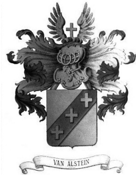
Wapen van Alstein 63 waarvoor dank aan Jhr Frédéric d’Hoop