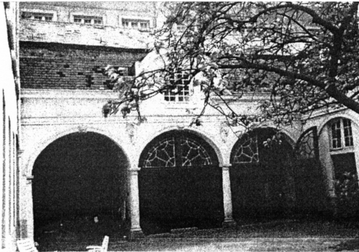
Hotel Verhaegen-Lammens Achterbouw. Koetshuis.