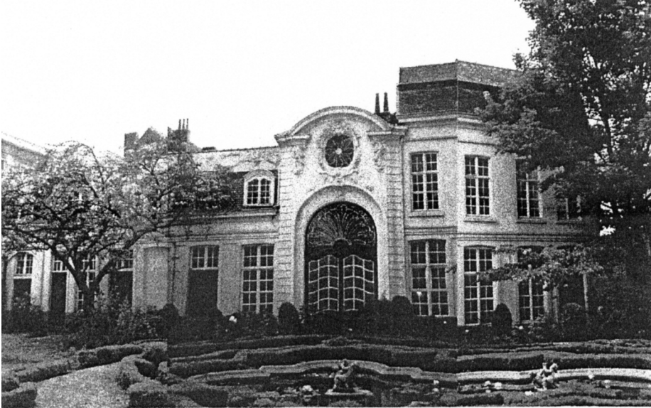
Hotel Verhaegen-Lammens Achterbouw. Tuinglevel.