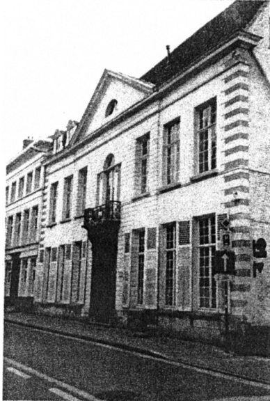
Hotel Verhaegen-Lammens Voorgevel hoofdgebouw.