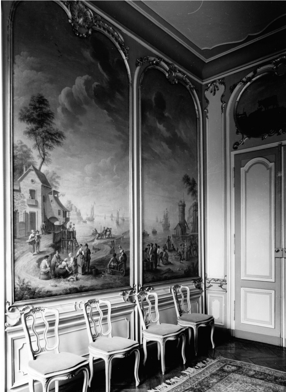
Hotel Verhaegen-Lammens Interieur met panelen van Pierre-Norbert Van Reysschoot.