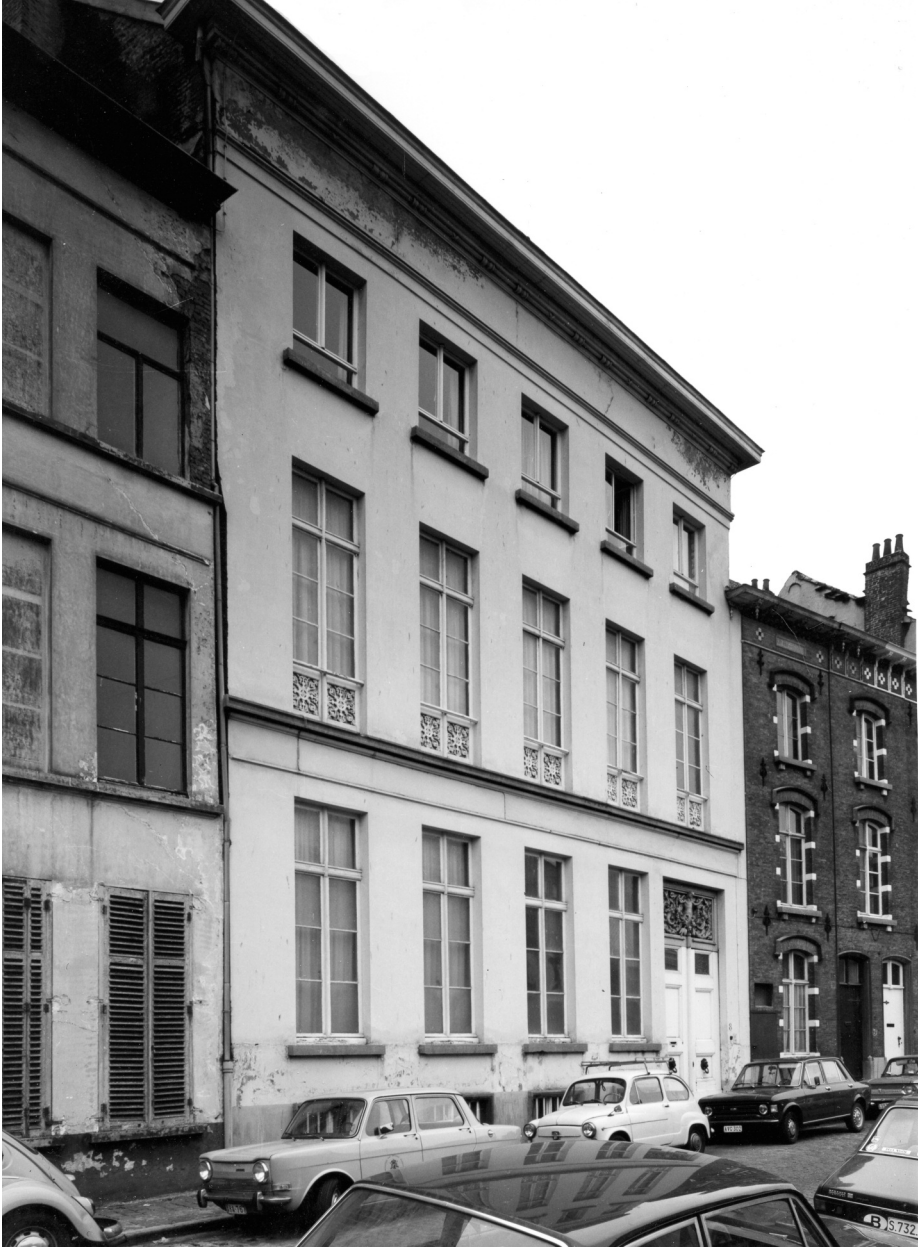
Huis Minard op de Grote Huidevettershoek