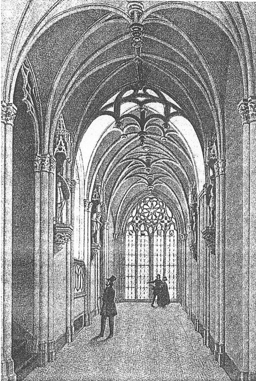
De ingang van het Huis Minard.