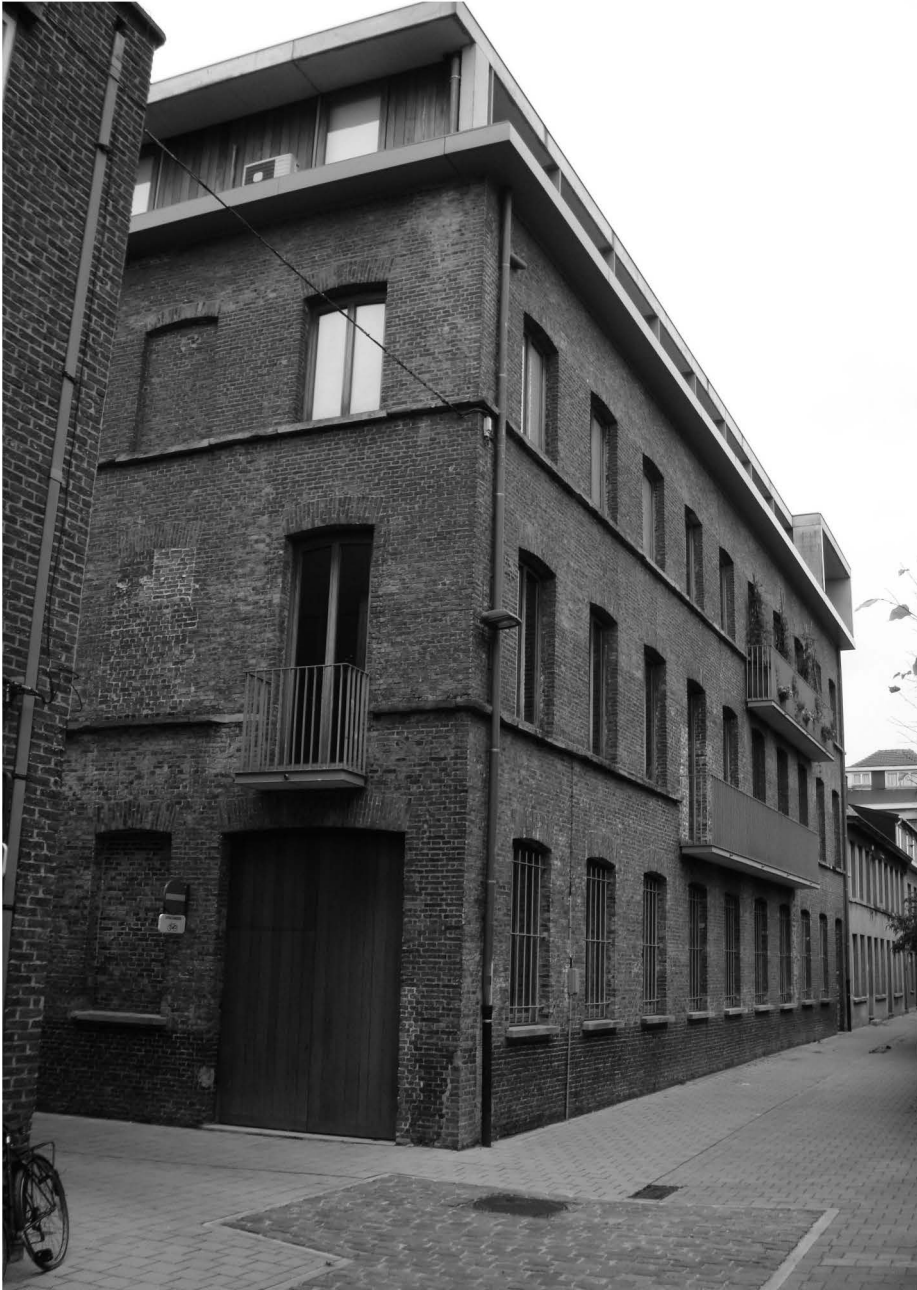
Het stadsmagazijn (2010, links Napoleon Destanbergstraat, rechts Sint-Agnetestraat) waarin, onder andere, de stedelijke kloefkapperij ondergebracht was.