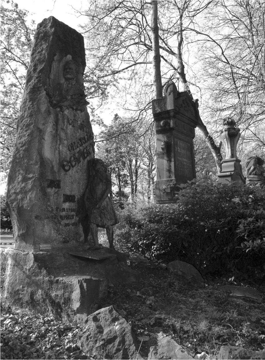
7. Grafmonument Gevaert op de Westerbegraafplaats.