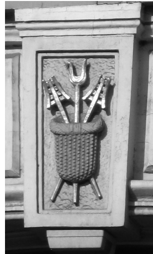
3. Brouwerij-embleem boven de koetspoort.