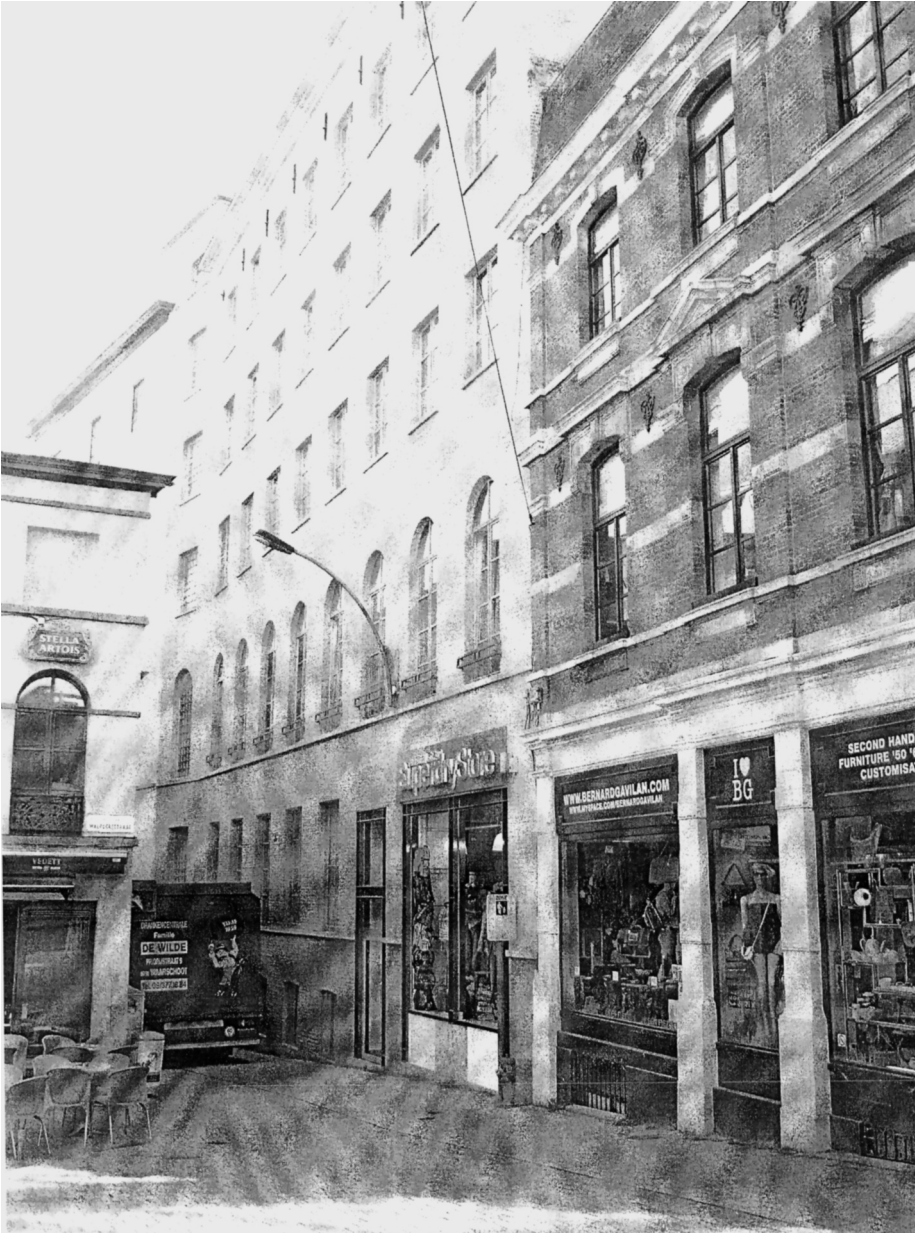
De gloeikousjesfabriek Schulze omgevormd tot loft (midden)