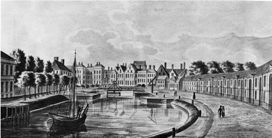
Het Keizerlijk Entrepôt op de Coupure.

Men besloot dan maar wijselijk het Stapelhuis te bouwen dààr waar de goe-