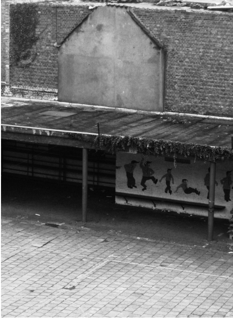
Gecementeerde gevel van het Braeckmanbeluik, thans speelplaats van het Hoger Technisch Instituut Sint-Antonius.