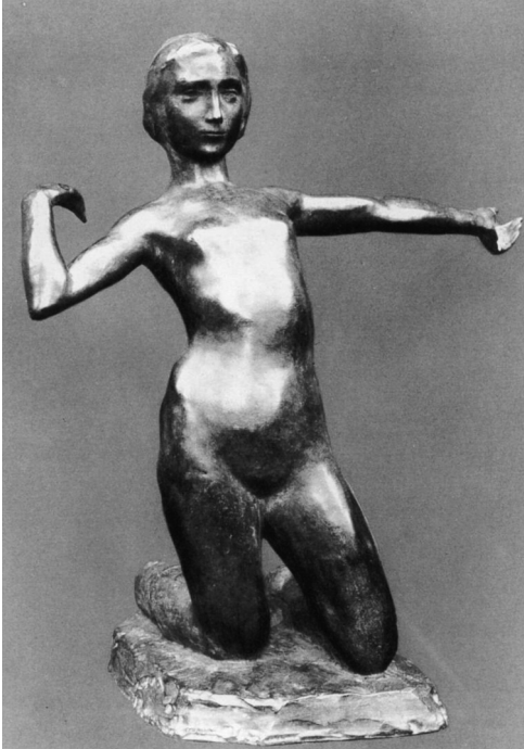
George Minne, Eva I (1913), Privaatverzaming

fessor. Aan de armste leerlingen schonk hij verfkasten en allerlei materiaal”.