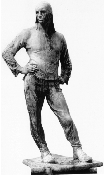
Constantijn Meunier, Buildrager (gegoten in 1950 bij Minne), Antwerpen, Suikerrui