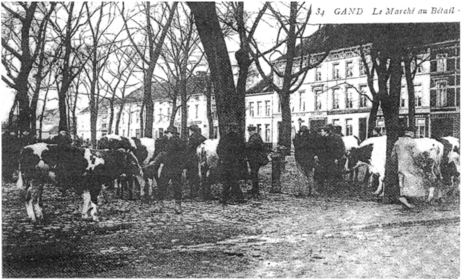
De nieuwe Beestenmarkt vóór 1929 (nog niet overdekt)