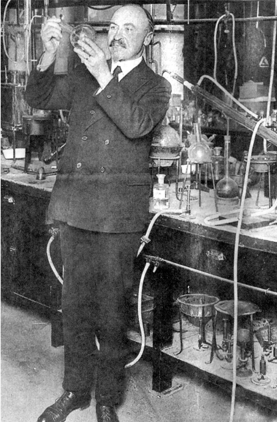
Leo Baekeland in zijn labo waar het bakeliet tot stand kwam.