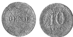
Tin - 23,5 mm - 3,50 g Voorzijde: GEND Keerzijde: 10 CENTS