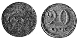
Tin - 23,5 mm - 3,60 g Voorzijde: GEND Keerzijde: 20 CENTS