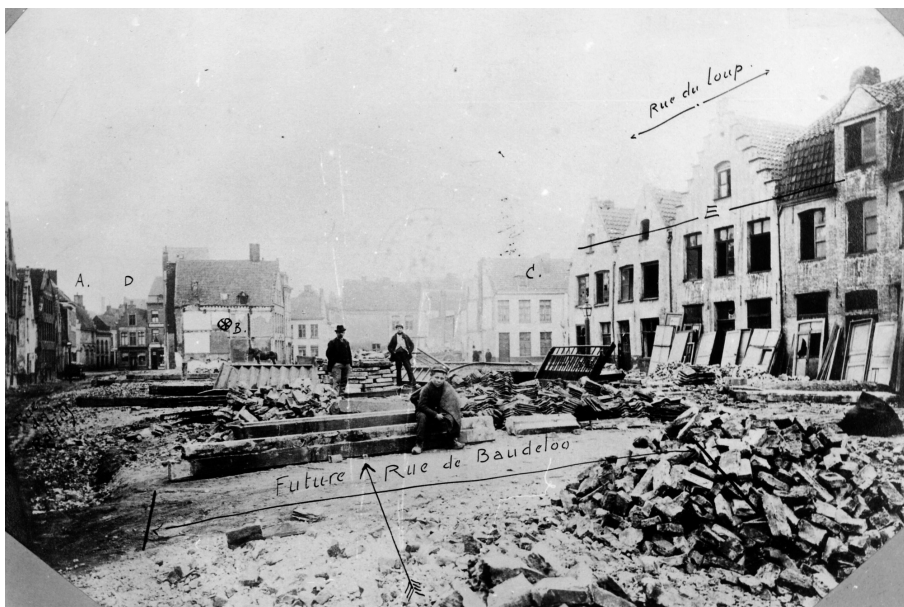
Afbraak van de Wolf- en Druifstraat naar aanleiding van de aanleg van de Baudeloostraat

De huizen, vanaf de Vrijdagmarkt 17 tot en met de Baudeloostraat 19, zijn door hem ontworpen. De huizen hebben geen souterrain. Arduinen plinten, bakstenen bovenbouw, afgewisseld met kalkzandsteen en hardsteen voor de venster- en geveltopversiering. Meer dan de helft van de huizen heeft een loggia, balkon of erker. Sterk vertikaal karakter. De woningen die hij ontwierp