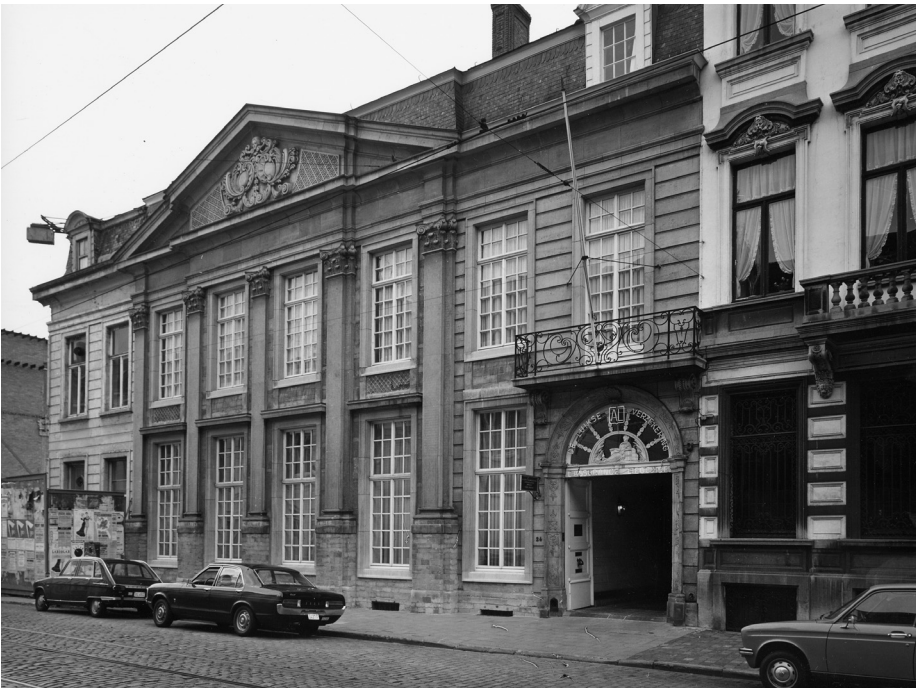
Hotel Reylof in de Hoogstraat

Dat Latijnse verzen in het Gent van toen goed verkochten, hoeft ons niet te verwonderen, het onderwijs in de colleges gebeurde immers in deze taal.