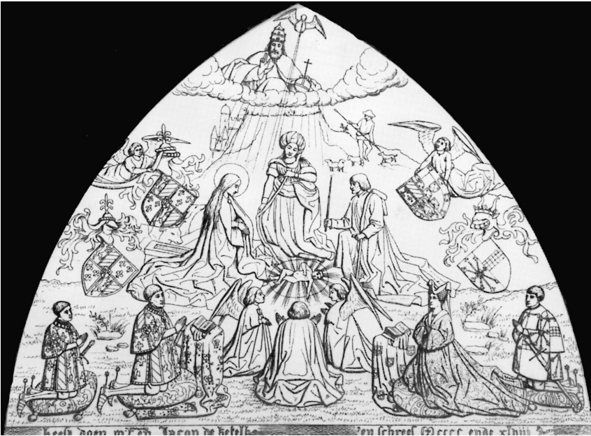
Reconstructie van het schilderij door Felix De Vigne