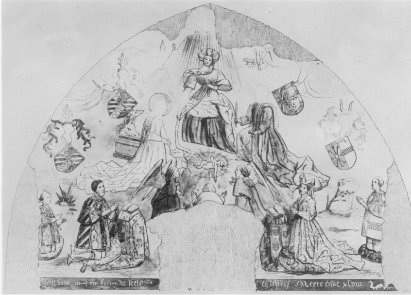
Tekening van de bestaande toestand in 1856 door Felix De Vigne