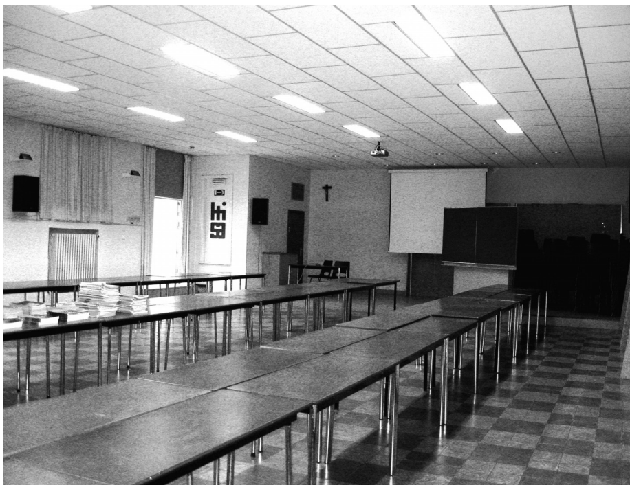
Zaal Flora, thans polyvalente zaal van H.T.I.St.-Antonius

29 juli 1811. In de Holstraat woonde in die periode nog een andere belangrijke hovenier, Pieter Antoon Verschaffelt (1764-1844). Hij hield een dag later op 30 juli een grote planten- en bloemenverkoop 12 . In 1813 diende Lanckman een bouwaanvraag in om de gevel waar de bibliotheek van de maatschappij gevestigd was te verbouwen. Hij wilde een afzonderlijke toegang zodanig dat de bibliofielen niet langer meer door de herberg moesten. Het was een bepleisterde classicerende gevel, kenmerkend voor die periode. Wat de Maatschappij voor Landbouw en Kruidkunde betreft, kende deze -ondanks de grote aangroei van het aantal leden- in die periode ook duistere momenten. De oorlog tussen de geallieerden, die eind 1813 in ons land verschenen, en Napoleon maakte het in 1814 onmogelijk om in februari een tentoonstelling in te richten. Nochtans was 1814 -niet alleen voor Waterloo- maar ook voor Gent een zeer belangrijk jaar.