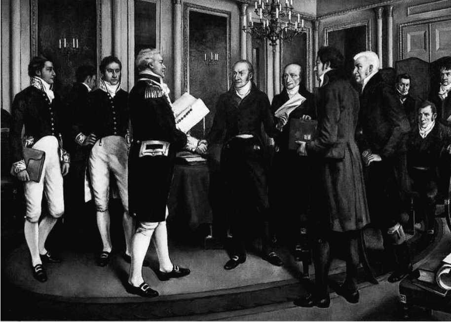
De ondertekening van het Vredesverdrag van Gent. Van links naar rechts: Henry Goulburn, Anthony J. Baker, William Adams en James Gambier; John Quincy Adams, Albert Gallatin, Henry Clay, James Bayard, Christopher Hughes en – gezeten – Jonathan Russel. De man in profiel achteraan is niet geïdentificeerd.

Men richtte te Gent allerhande feestelijkheden in om het historisch feit te vieren. Op 1 januari 1815 ontving Adams een nieuwjaarsbrief van de maatschappij ‘Couronne tressée de plantes de l’Amérique Boréale et offerte à la société d’Agriculture et de Botanique de Gand; félicitations adressées à ll. Ee. Mm. Les ambassadeurs des Etats-Unis, membres honoraires de ladite Société à l’occasion de la conclusion de la paix et du renouvellement de l’an. 1 janvier 1815’ . Deze prozatekst bevatte bovenaan een ingesneden bloemenkroon met opschrift ‘Florae Americanae flora belgica offerebat’ en zestien begeleidende nota’s door Norbert Cornelissen 21 . De Amerikanofilie beheerste dus duidelijk ook de maatschappij.