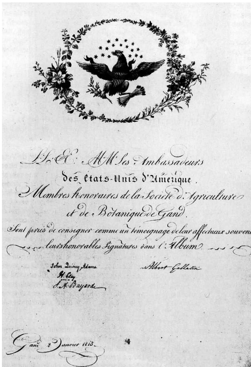
Erebladzijde uit het Guldenboek van de Maatschappij voor Landbouw en Kruidkunde met de handtekeningen van de Amerikaanse afgevaardigden, dd. 2 januari 1815. Gent, Kon. Maatschappij voor Landbouw en Plantkunde

In de hoop het zeevaartmonopolie van de Engelsen een slag te kunnen toe-brengen had Frankrijk op 4 juli 1776 de Verenigde Staten van Amerika hun onafhankelijkheid uitgeroepen. Alhoewel dit aanvankelijk geen gehoor vond, hielden de Verenigde Staten tijdens het bewind van Napoleon zich afzijdig van de strijd tussen de twee grootmachten om zodanig profijt te slaan uit de oorlogssituatie. De Amerikaanse president Jefferson kon niet langer meer schip-pereen tussen de twee partijen en kondigde de Embargowet af, waardoor hij alle handel met het buitenland verbood. Het gevolg was ook dat deze maatregel de Amerikaanse economie verstikte.