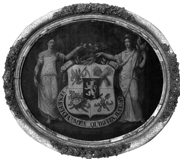
Wapenschild van de Koninklijke Maatschappij voor Landbouw en Kruidkunde, Gent, Verzameling Kon. Maatschappij voor Landbouw en Kruidkunde