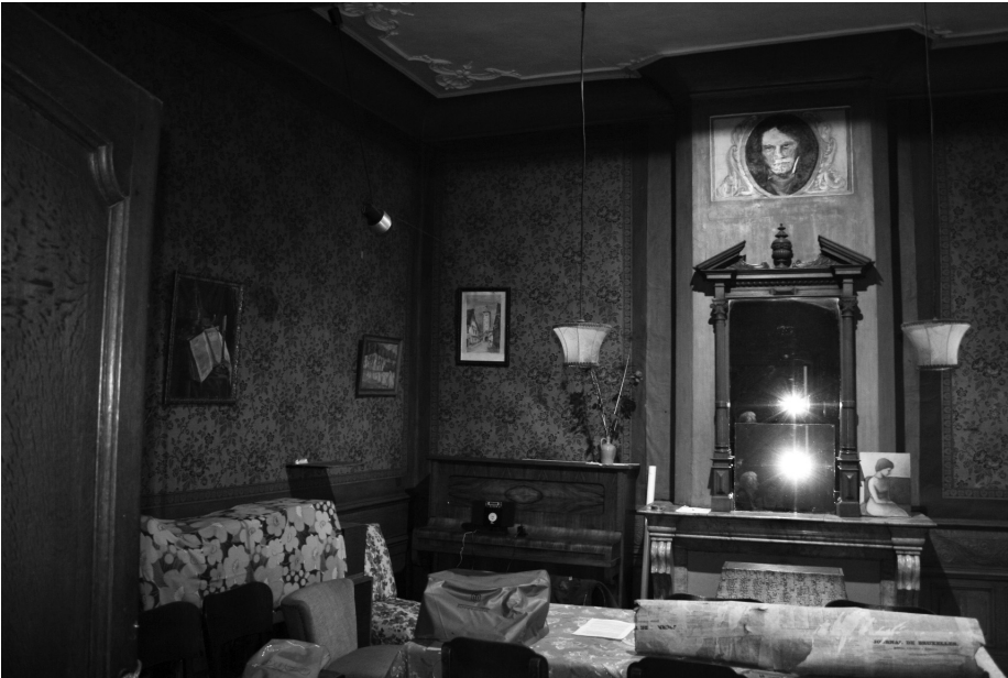
Afb. 3 Salon op de benedenverdieping

De indeling op de benedenverdieping is nog origineel: een inkompartij met twee kamers aan de straatkant (salon en wachtkamer), een trapzaal en een grote kamer in het midden en achteraan de eetkamer en de keuken.