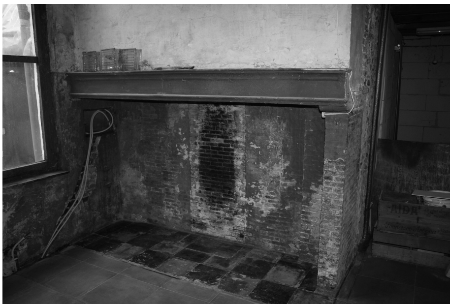
Afb. 6 Keuken met haard

De dienstvertrekken waren in een afzonderlijke vleugel ondergebracht die paalt aan een binnenkoer en twee bouwlagen heeft. Beneden was de keuken met een haard en een oude stenen vloer. Hij stond in verbinding met de eetkamer, de voorraadkelders en de straat.