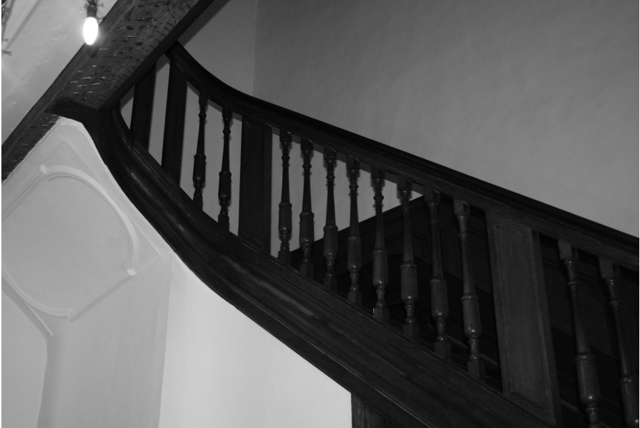
Afb. 4 Trap Nederpolder