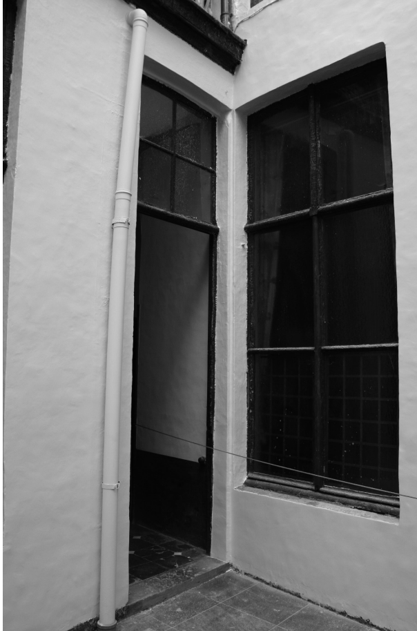
Afb. 7 Binnenkoer met toegang tot keuken

Vanuit de voormalige keuken vertrekt een diensttrapje naar een kleine vestibule met een eikenhouten borstwering. In de vestibule geeft een deur toegang tot de vroegere leefruimte (met haard) voor het personeel, een tweede deur leidt naar de zolders van het hoofdgebouw waar ook slaapruidten (voor gasten of personeel) ondergebracht waren. Daarboven zit een mansardedak. Ook op de eerste verdieping is de indeling origineel: twee kamers aan de straatzijde, een klein kamertje naast de trap (nu ingericht als badkamer), een grote kamer in het midden en twee kamertjes achteraan. Ook hier mooie eikenhouten deuren, plankenvloeren, plafonds met stucversieringen en enkele schouwen in beschilderd hout met marmerimitatie. Boven twee schouwen zitten grote 19de-eeuwse spiegels in vergulde lijsten.