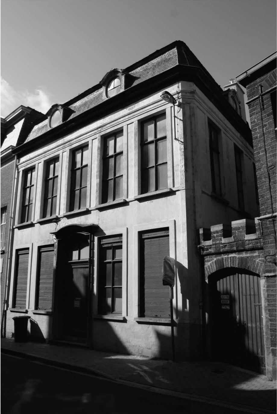
Afb. 2 Gevel in 2007