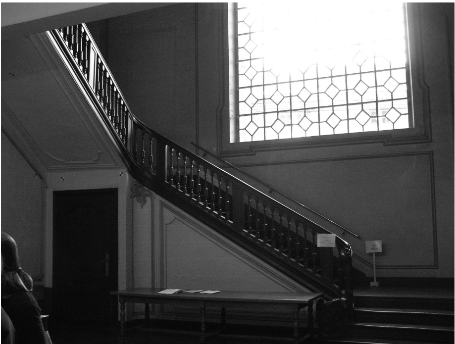
Afb. 5 Trap in het diocesaan centrum Biezekapelstraat