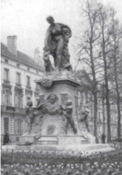
Gedenkteken Oswald de Kerchove - 1923.