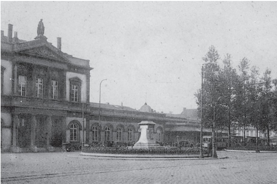
Voetstuk gedenkteken Oswald de Kerchove (WOI).