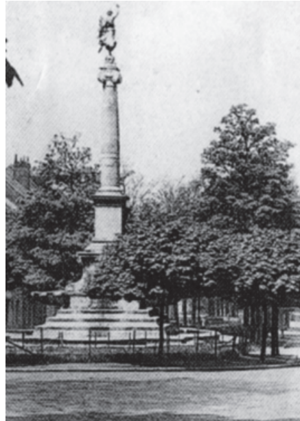
Gedenkteken Charles de Kerchove - 1898