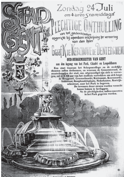
Affiche inhuldiging gedenkteken Charles de Kerchove - 1898