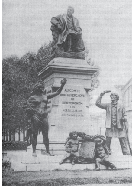
Gedenkteken Oswald de Kerchove - 1908.