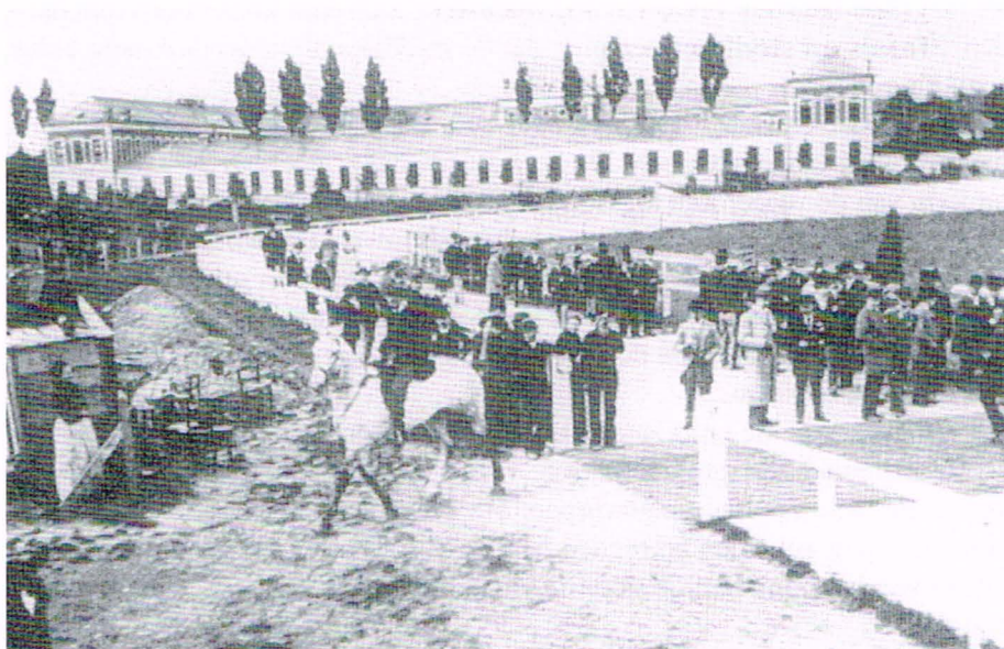
Op de achtergrond het weesjongensgesticht. Op de Velodroom werden ook paardenwedstrijden georganiseerd, zoals deze van 7 mei 1899, ingericht door de Gentse "Cercle Équestre".