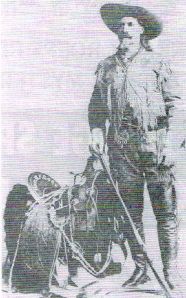
Buffalo Bill - 1846-1917.

Het gezelschap arriveerde 's nachts in het station aan het Arsenal en sloeg zijn tenten op op het exercitieplein. Alles in de puntjes en feilloos georganiseerd.