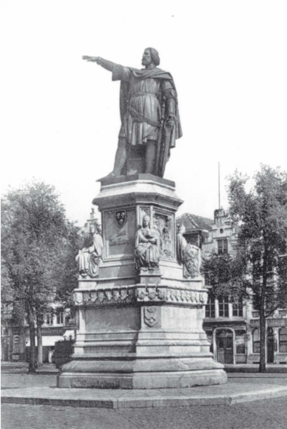
Standbeeld van Jacob Van Artevelde, ingehuldigd op 14 September 1863.