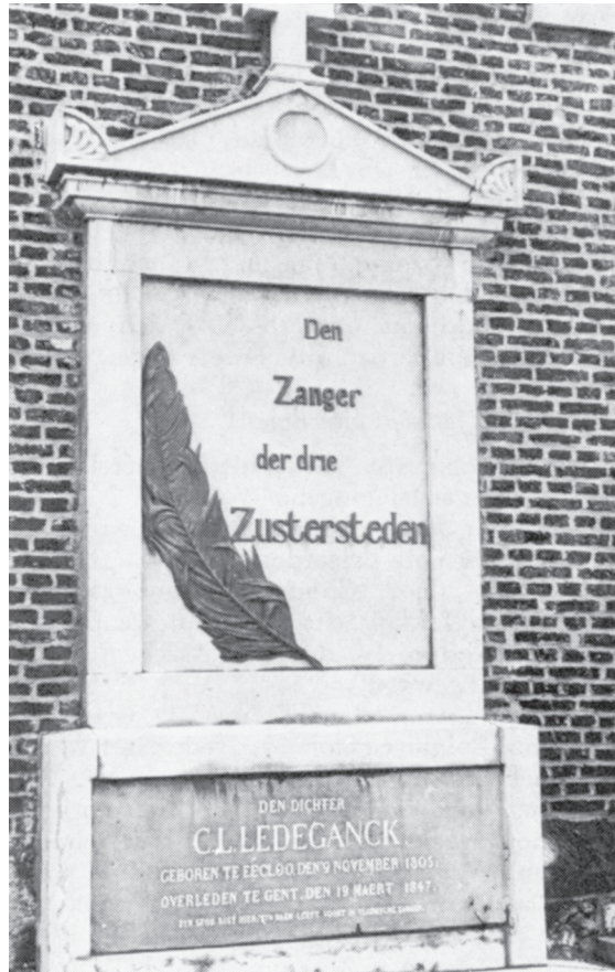
Karel Lodewijk Ledeganck (1805-1847)

Verkozen tot Provincieraadslid in 1841 zal hij als eerste in deze Raad, na 1830, er het woord voeren in het Nederlands.